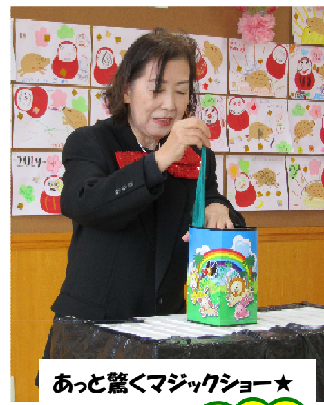
あっと驚くマジックショー★