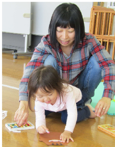
イノシシの絵を描き、ビニール袋に貼って凧を作ったよ