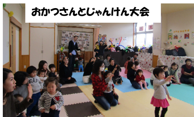
おかつさんとじゃんけん大会