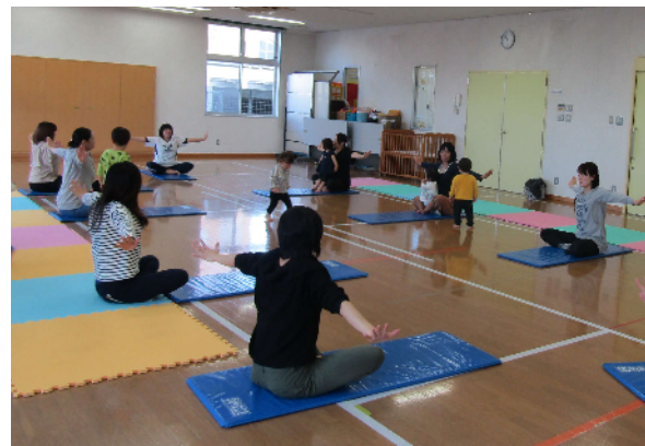
親子ヨガウォーミングアップ