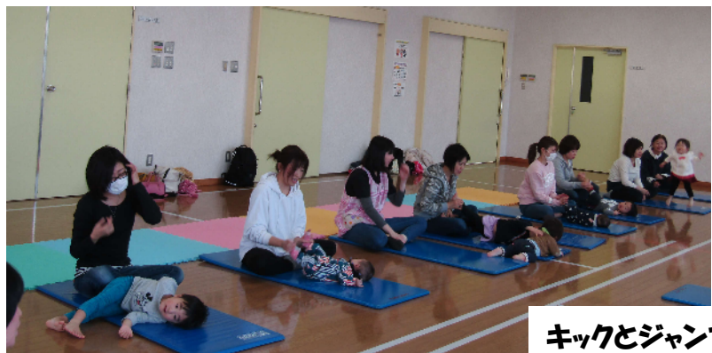
キックとジャンプのポーズ