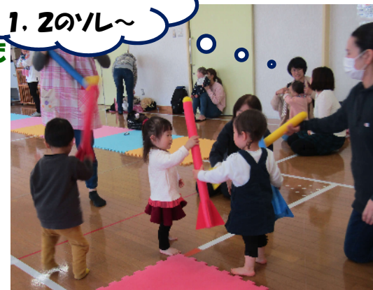
フォームロケット