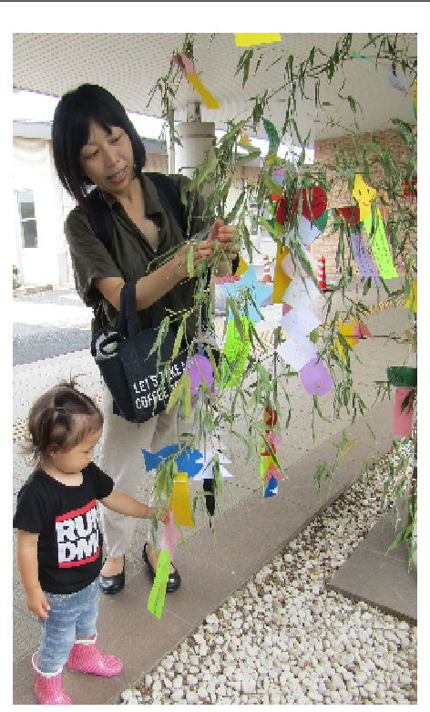
みんなで大きな笹竹に飾りました