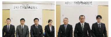
着任した先生たち(左・小学校 右・中学校)