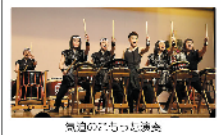
気迫のたざり演奏