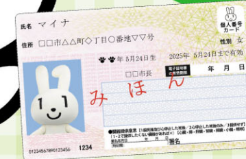
マイナンバー PPキャラクター マイナちゃん

マイナンバーカードを使って予約・申込みをし、選んだキャッシュレス決済サービスでチャージや買い物をすると、利用額の 25% の ポイント還元 が受けられます(ポイント付与の上限は一人あたり最大 5,000円 )。