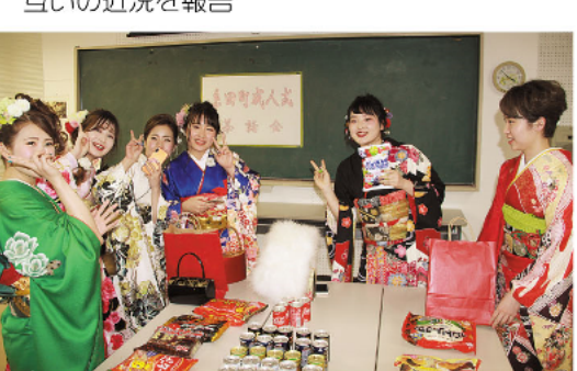
互いの近況を報告