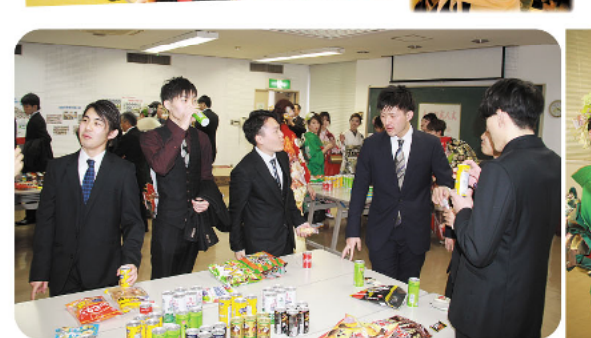
茶話会での楽しいひと時