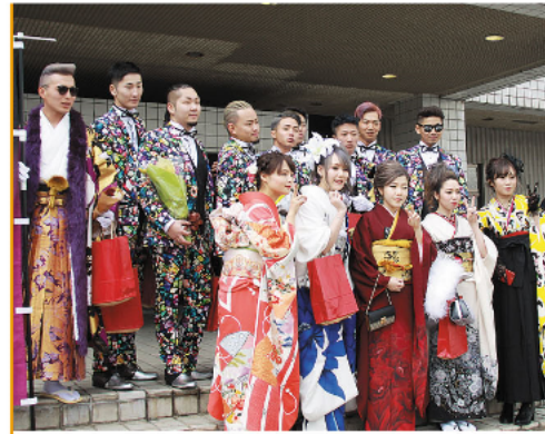
同級生で記念撮影