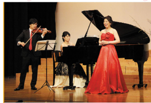
素晴らしい歌声やバイオリン・ピアノの演奏