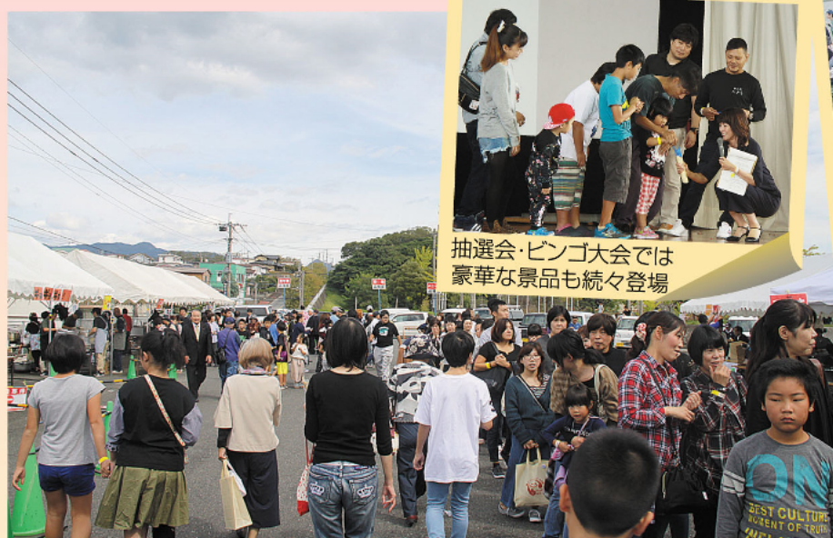
青空の下、飲食ブースは大盛況