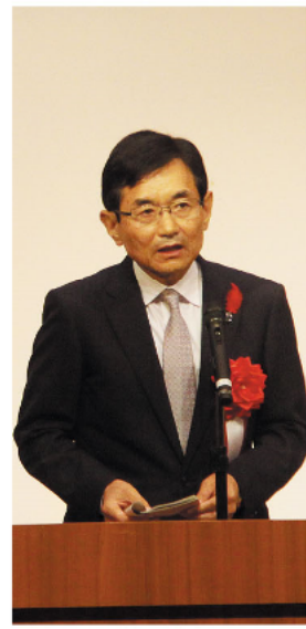
祝辞を述べる江口勝 副県知事