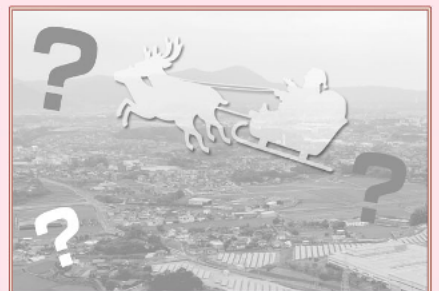
12月 今月は、あなたが主役かも!?