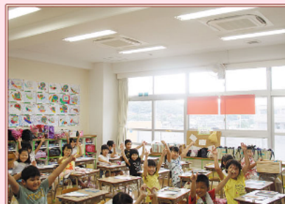
8月 小・中学校クーラー設置