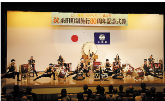
オープニングを飾った「和太鼓たぎり」