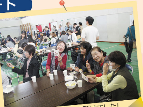
来場者の人にも楽しんで頂けました！