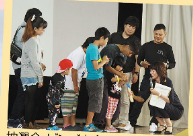
抽選会・ビンゴ大会では豪華な景品も続々登場