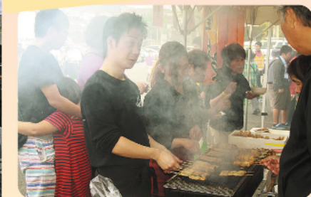
その場で焼いて、お店さなからの味