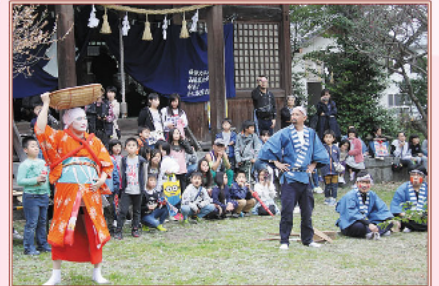
3月 町の伝統行事「田植祭」開催