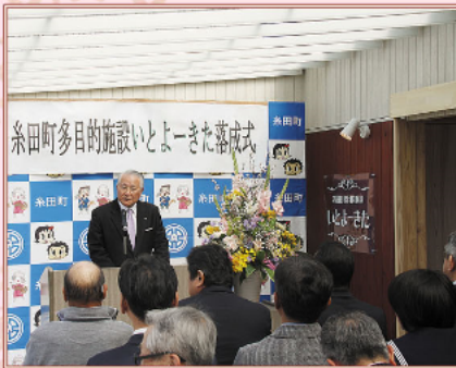
4月 多目的施設「いとよきた」が完成