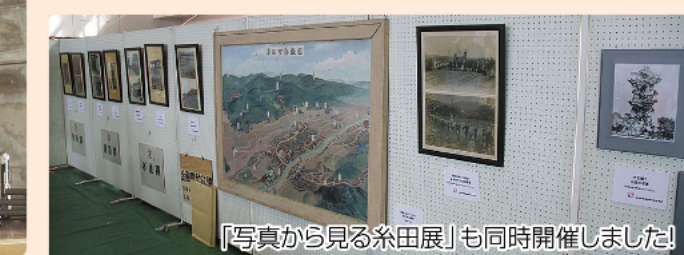
「写真から見る糸田展」も同時開催しました

式典後は、会場を町民体育館に移し、商工会による紅白餅まきで記念イベントがスタート。「和太鼓たぎり」の演奏や豪華景品の当たるビンゴ大会や抽選会などがおこなわれました。会場の外では、町内飲食店などがブースを出店して、無料でカレーや石炭ソフトなどを振る舞いました。天候にも恵まれ、会場には子どもから大人まで800人以上のお客さんが訪れ、賑やかな雰囲気になりました。