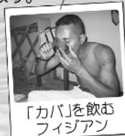
「カバ」を飲むフィジアン

まず、これです、これ。フィジーに足を踏み入れたら必ず通らなければならない儀式のひとつです。「カバ」とはコショウ科の木の根っこを乾燥させ、粉末状にしたものを水に溶き、布でこして「タノア」という木製の器にそそぎ、儀式的に飲みまわします。