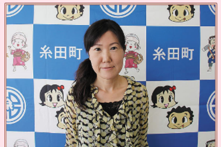
9月 糸田町初「地域おこし協力隊」就任