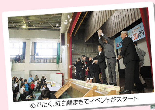
めでたく、紅白餅まきでイベントがスタート