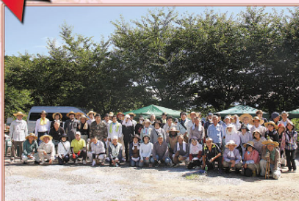
7月 「金山アジサイ園」ボランティア集う