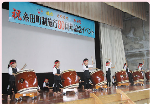
華麗な太鼓の演奏で園児たちも盛り上げてくれました！