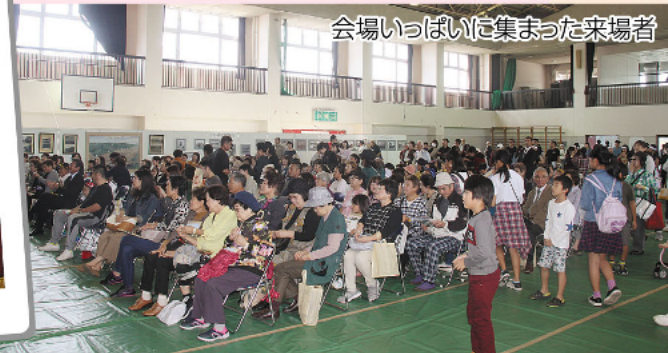
会場いっぱい集まった来場者