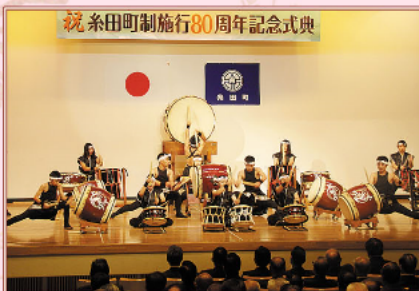
10月 「町制施行80周年記念式典」開催