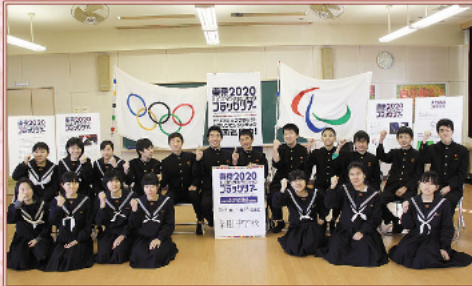
1月 2020東京五輪フラッグツアーが糸田町に届く