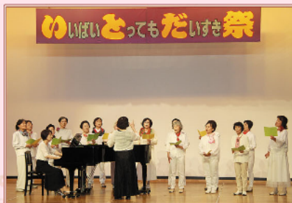
11月 秋の恒例行事「いとだ祭」開催