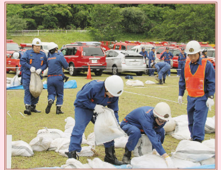
6月 災害に備えて糸田町で「水防訓練」開催