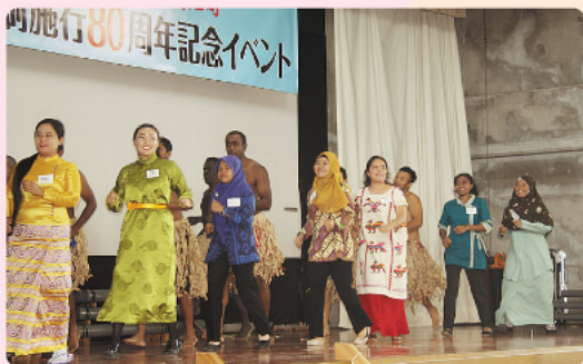
オイスカ国際交流のメンバーも参加してくれました！