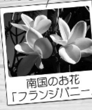
南国のお花「フランジパニー」

来月はそんな遠いようで近いフィジーを「フィジー語」も交えつつ、愉しく紹介していきたいと思っています。どうぞお楽しみに！