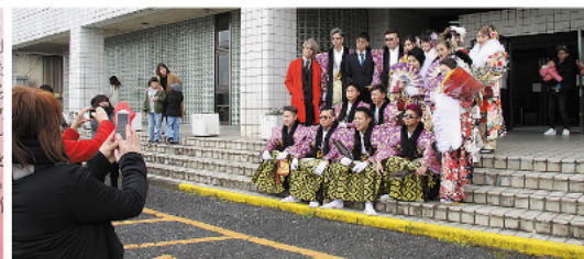
晴れ舞台を写真におさめます