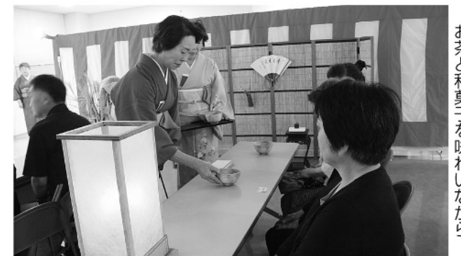
お茶と和菓子を味わいながら

中秋の名月の9月15日、町民会館2階で観月会が開かれました。今年で31回を迎える会に、全5席で約150人が来館。各茶席では吟詠が披露され、ほんわりと夜空に浮かぶ月を見ながら季節の折り目を堪能しました。掛け軸や生け花が飾られた1階ロビーでも、多くの人が足をとめ観賞にひたりました。茶席後、恒例の抽選会では当たった景品を笑顔で見せ合う姿がありました。