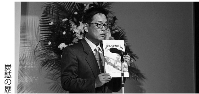
炭鉱の歴史感慨深く