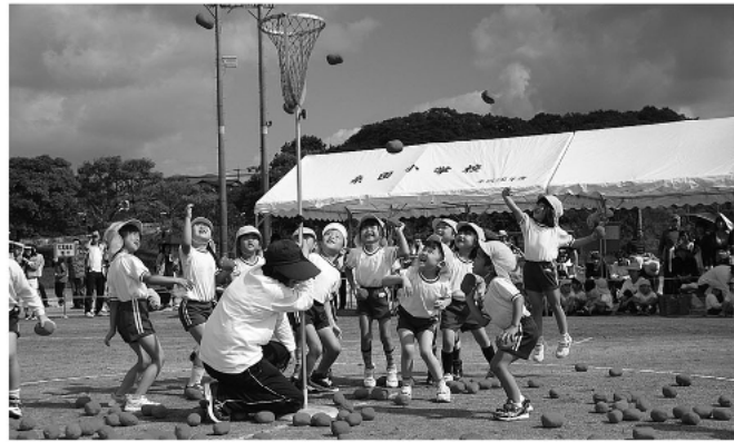
みんなで力を合わせて

披露目。炭坑節やソーラン節を迫力いっぱい披露すると、保護者から大歓声が上がりました。どの競技にも一生懸命に取り組む姿に、子どもたちの健やかな成長を感じることができた一日となったのではないのでしょうか。