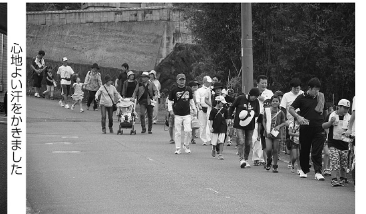
心地よい汗をかきました