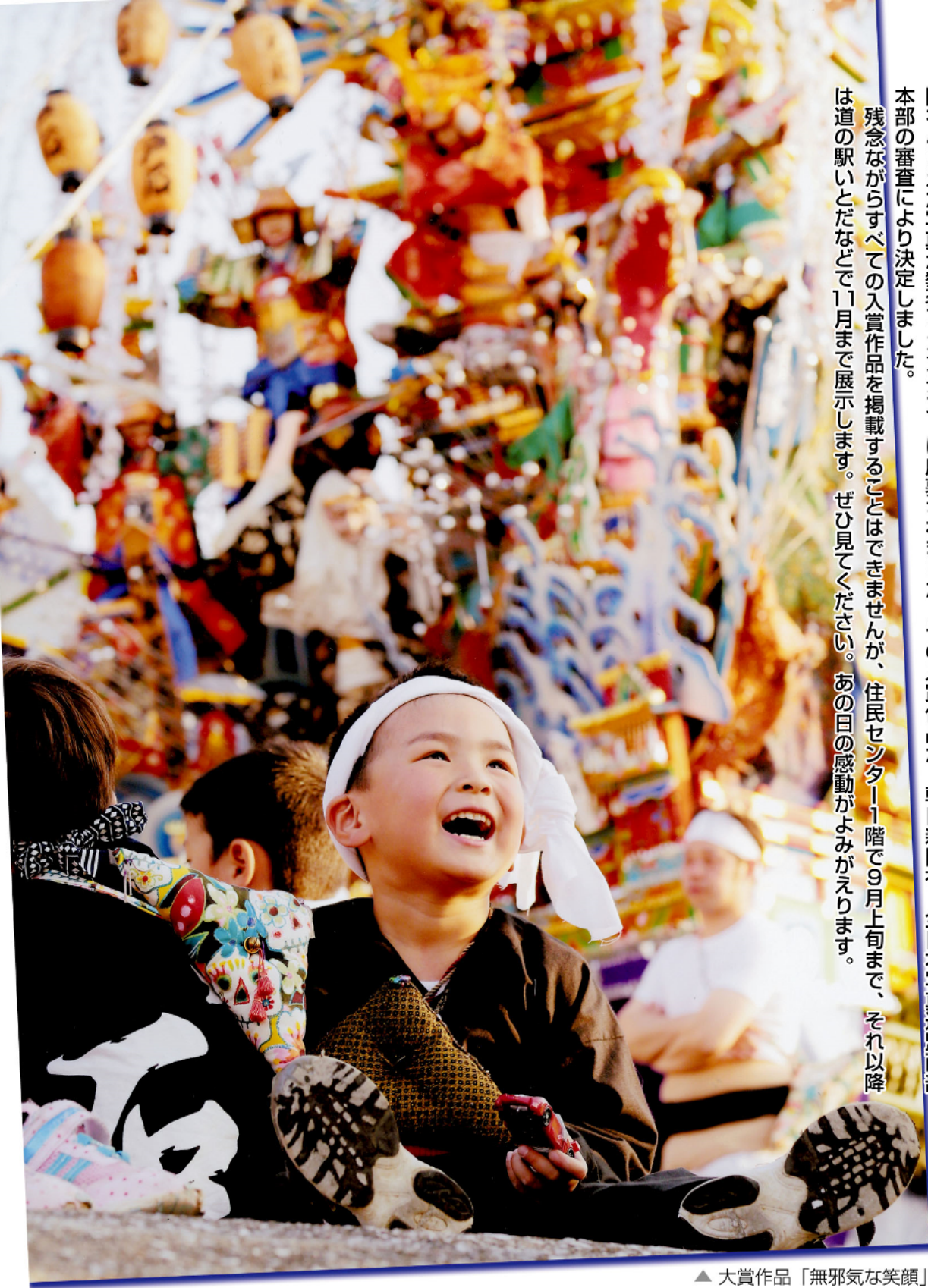
▲ 大賞作品「無邪気な笑顔」

残念ながらすべての入賞作品を掲載することはできませんが、住民センター1階で9月上旬まで、それ以降は道の駅いとだなどで11月まで展示します。ぜひ見てください。あの日の感動がよみがえります。