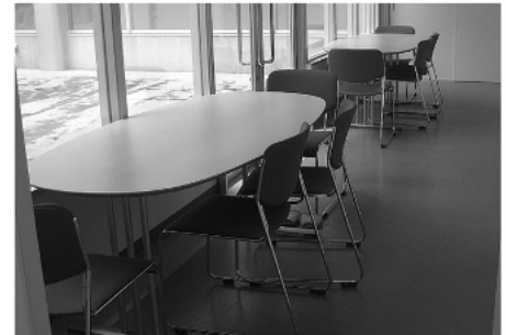
←疲れたら、休憩コーナーへ。適度な運動と、こまめな水分補給を心がけてください。