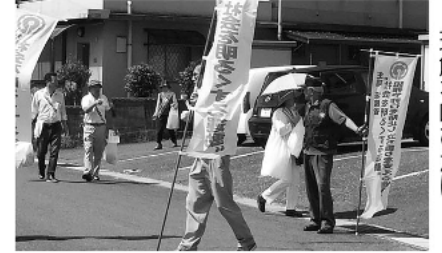
更生保護の正しい理解を呼びかけ

7月の社会を明るくする運動強調月間にあわせて、子どもたちを水の事故から守ろうと、7月3日に啓発パレードがおこなわれました。保護司や補導員のほか、民生委員や小・中学校などから約30人が参加。町内をパレードしながら啓発チラシなどを配布しました。安心・安全な町づくりをするにはみなさんの力が必要です。地域に根差した幅広い活動を広げ、水の事故をなくし、協力して明るい社会を作りましょう。