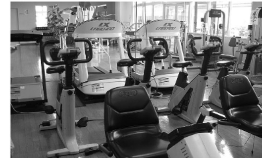
←トレーニング室には各種マシンがそろっています。歩いたり走ったり、自転車をこいだりして筋力トレーニングができます。

今年は新たに、ゆっくり休める休憩コーナーを設置しています。男性の指導員も1人増えました。これからの健康づくりに、ぜひ活用してください。