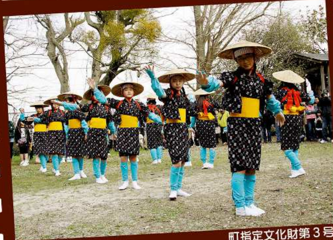
町指定文化財第3号