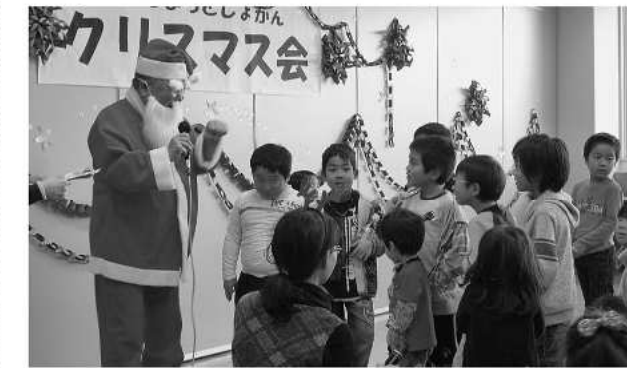
盛り上がった質問タイム

の日よりちょっぴり早くサンタが会場を訪れ、来場した子どもたち全員にプレゼントを手渡してくれました。