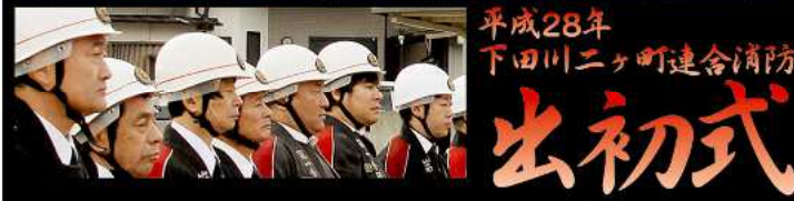
平成28年 下田川二ヶ町連合消防 出初式