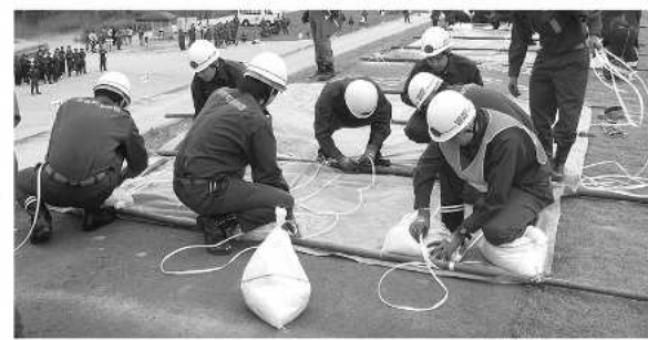
町の各消防団員が一致団結

6月7日に大任町水辺公園で田川地区消防本部の水防訓練が実施され、市町村消防団など10チームが参加しました。訓練では各チーム8人がシート張り工法に挑み、その速さや正確性を競いました。シート張り工法とは、ブルーシートなどに竹を結び、重りとして土のうを取り付けた状態で河川へ投入し、川の斜面や堤防の漏水を防ぐものです。 梅雨を目前に、消防団員は連携を深め、素早い対応と技術の習得に臨みました。