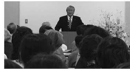
人気の講座が今年も幕開け