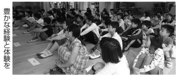
豊かな経験と体験を

小学校の多目的ホールで、5月16日に土曜サークルの開講式がありました。本年度は料理・パソコン・野外活動・書道・折り紙・昔遊びの6教室が開かれ、64人の児童が参加します。 月1回の体験教室では、普段の生活では味わえないさまざまな体験が待っています。それぞれの活動に積極的に取り組み、最後まで継続することが子どもたちの力となるでしょう。