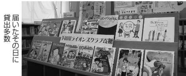
届いたその日に貸出多数

下田川ライオンズクラブから小学校に図書が寄贈されました。5月12日に図書室に届けられた真新しい75冊は、図書室の入口から見て真正面に設けられたコーナーにズラリと並べられています。昼休みや放課後にはさっそく貸出がありました。 子どもたちへ心のこもった贈り物です、新しい趣味の発見や調べ学習など幅広く利用できるといいですね。