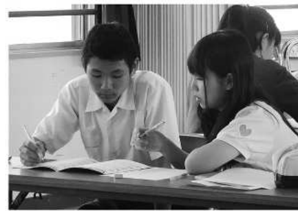
苦手克服に向けて徹底指導

学力補充教室の開講式が6月初旬、小・中学校でそれぞれ開催されました。この教室では小学4年生～中学3年生を対象に、学校外の時間で理解不十分なところを補っています。県立大生や地域の人たちで構成する講師陣が、一人ひとりわかりやすく指導してくれています。継続は力なりといいますが、参加した児童・生徒のみならずこれから1年間、続けることが学力向上につながると頑張ってくれることでしょう。 ※対象学年の児童・生徒を随時受け付けます。詳細は担任の先生か教務課 学校教育係 電話26-3788 まで問合せください。