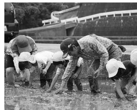
大事の一つひとつ植えました