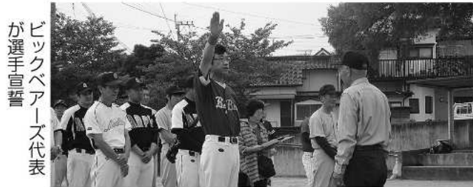
ピックベアーズ代表が選手宣誓

町民グラウンドで7月5日、伝統ある壮年ソフトボール連盟のリーグ戦が開幕しました。壮年ソフトボールは地域のコミュニケーションや健康増進が目的です。行政区などから40～60歳を主とした8チームが参加。これから毎週日曜日に熱戦を繰り広げます。