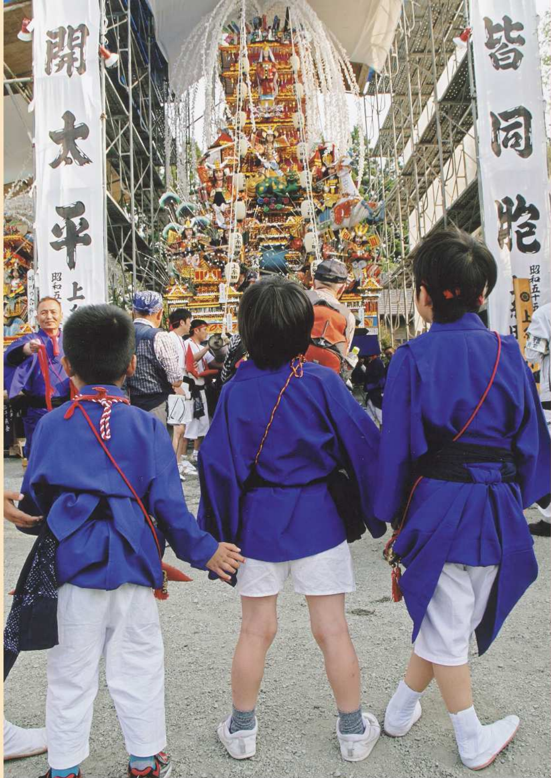
▲ 大賞作品「あこがれ」

残念ながららすべての入賞作品を掲載することはできませんが、住民センター1階で11月初旬まで展示していますので、ぜひ見てください。あの日の感動がよみがえります。