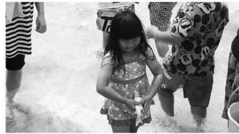
やさしく慎重に運びます

6月14日、天候に恵まれた中学校プールで魚つかみ取り大会がおこなわれ、元気いっぱいの4歳～中学生の約80人が参加しました。プールに放たれた450匹の大きささまざまな魚を見て、子どもも保護者も大興奮。子どもたちはプールをバシヤバシヤと走り回り、魚のすばしっこい動きに苦戦しながらもそっと抱き寄せるように捕まえていました。魚は各自持ち帰って大切に飼育します。