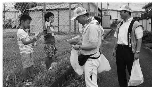
支え合い、見守る地域のチカラを

保護司や補導員のほか、民生委員や小・中学校、PTAなどから約30人が参加。町内をパレードしながら啓発チラシを配布しました。犯罪や非行が新たに起こらないようにするにはみなさんの力が必要です。地域で協力して明るい町づくりをしていきましょう。