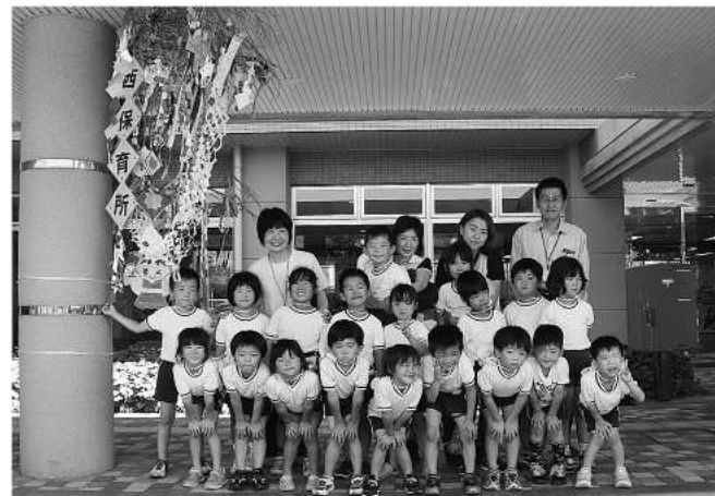
願い事がかなうといいな

園児たちが色紙で作ったかわいらしい織り姫と彦星や、願いを込めた短冊が華やかに飾られています。