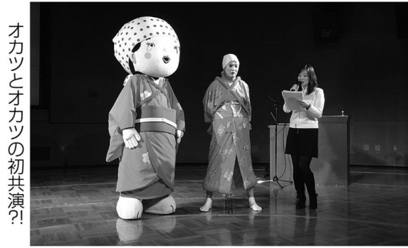
オカツとオカツの初共演?!

「放課後たがわ教室」の第2回目として、1月28日にアクロス福岡円形ホールで田植行事が披露されました。この教室は、田川広域観光協会が田川市郡の魅力的な観光資源を、福岡都市圏のみなさんに知ってもらおうと企画したものです。