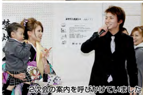
2次会の案内を呼びかけていました