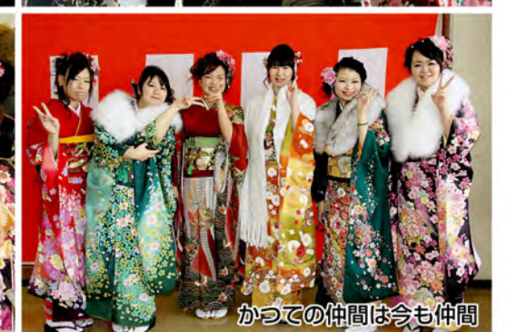
かつての仲間は今も仲間