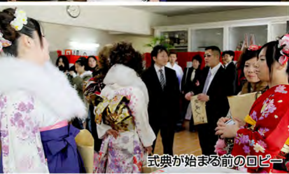
式典が始まる前の回廊