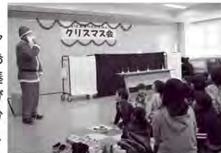
サンタさんの登場に会場から大きな拍手

また、最後にはクリスマスの日よりちょっと早くサンタさんが会場をおとすれ、プレゼントを来場された子どもたち全員に手渡してくれました。子どもたちからサンタさんへの質問タイムも大いに盛り上がり、優しいサンタさんに会えた子どもたちのうれしそうな笑顔が印象的でした。