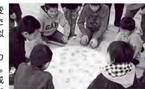
伝承の遊びに新鮮さを感じていました