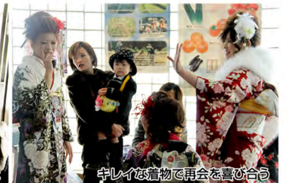
キレイな着物で再会を喜び合う