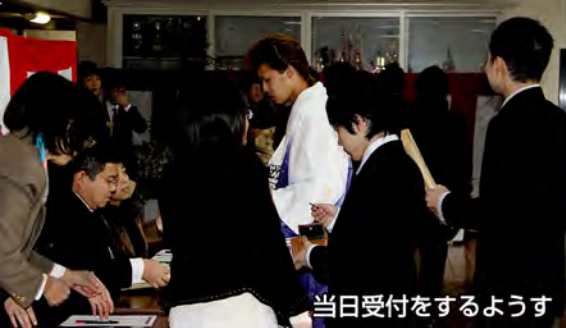
当日受付をするようす