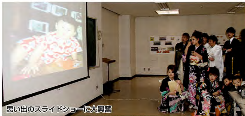
思い出のスライドショーに大興奮