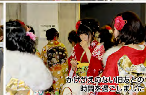
かけがえのない旧友との時間を過ごしました