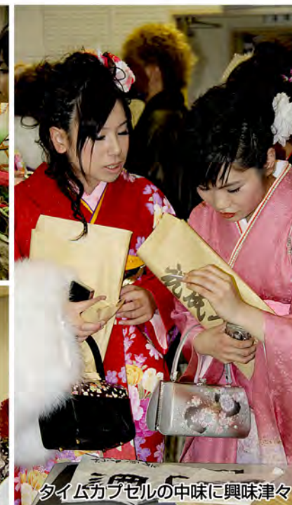
タイムカプセルの中味に興味津々