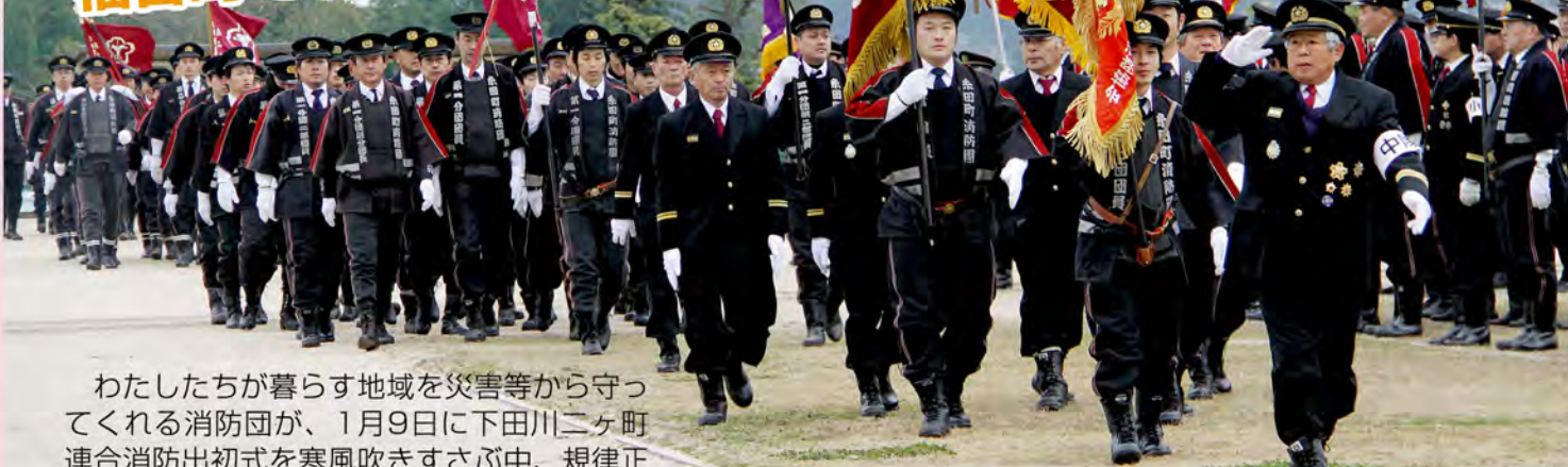
足並みを揃えた毅然とした行進

わたしたちが暮らす地域を災害等から守ってくれる消防団が、1月9日に下田川ニヶ町連合消防出初式を寒風吹きすさぶ中、規律正しくおこないました。