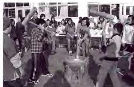
楽しいけど大変だったおもつつき

恒例となった土曜サークルの「餅つき大会」が、12月18日に糸田小学校で開かれました。子ども・保護者をあわせて、80人を超える人が参加してにぎわいました。子どもたちは、晴天の中「いち、に、さん、し」と掛け声をかけながら、楽しそうにもちをついていました。