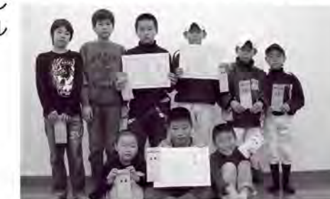
入賞者のみなさん