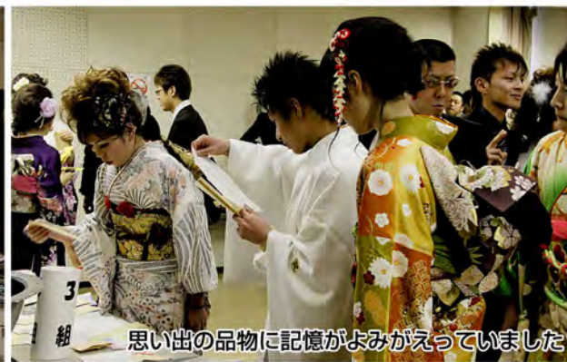
思い出の品物に記憶がよみがえっていました