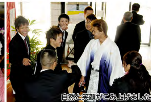
自然と笑顔がこみあげました