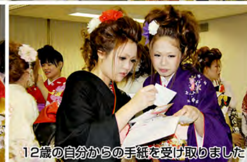
12歳の自分からの手紙を受け取りました