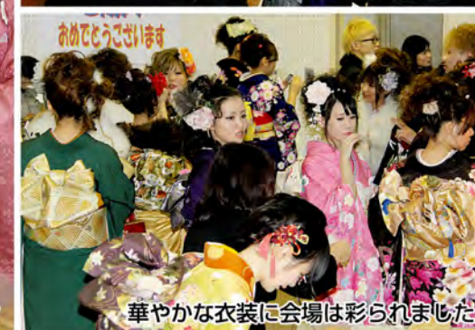
華やかな衣装に会場は彩られました