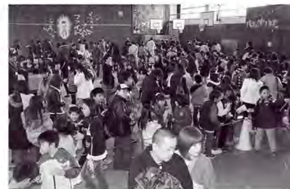
たくさんの人で埋め尽くされた体育館

2月6日にPTAが主催して小学校で不要品バザーがおこなわれ、多くの人でにぎわいました。