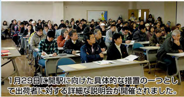
1月29日に開駅に向けた具体的な措置の一つとして出荷者に対する詳細な説明会が開催されました。