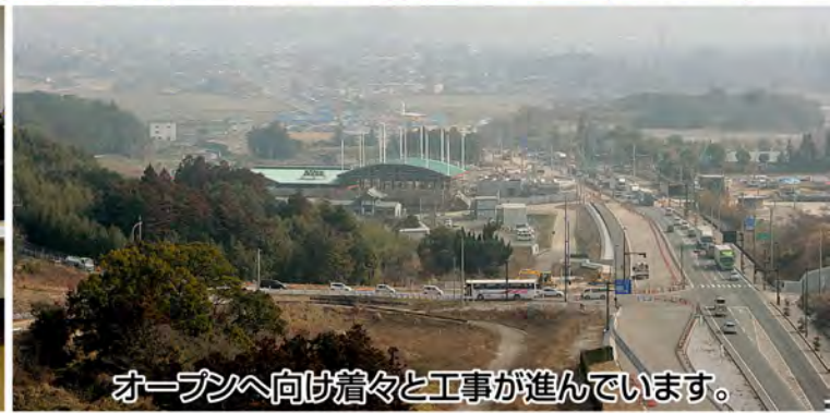
オープンへ向け着々と工事が進んでいます。