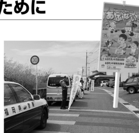
住民へ夏の安全を呼びかけています