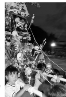
エンヤヤッサ コーラスヤッサ

この日に向けて太鼓や合唱などを猛練習してきた園児たちは、その成果をいかに発揮して来場した人たちの心を和ませ、さわやかな夏のひとときを演出していました。また、手作りの山笠を力強く舁いて自身の成長ぶりを存分に披露。響き渡る「エンヤヤッサ」の掛け声が夏の夜空に吸い込まれ、みんなの心に染み渡りました。