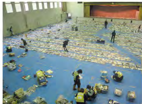
思い出の品がところ狭しと並べられている (宮城県気仙沼市唐桑体育館)

「あまりにも突然に「そのとき」はやってきた。マグニチュード9.0の地震は海と大地を大きく揺らし、見上げるほどの津波とともに東日本を飲み込んだ。まちなみ、人も、思い出も。」