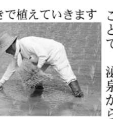
慣れた手つきで植えていきます

慣れた手つきで植えていきます。快く承諾してくれました。この日は、まだ苗が植えられていない部分に苗を植えたり、本数が少ないところをつき足したりする作業をしています。