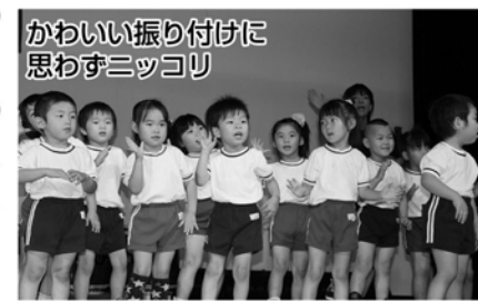
かわいい振り付けに思わずニコリ