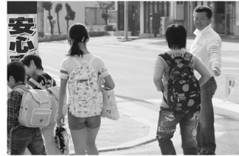
優しいまなざしで見守ります

子どもたちは地域の宝です。児童・生徒たちの朝夕の登下校、目の届く範囲でかまいませんので、声かけや見守りをお願いします。地域、町をあげて子どもたちを守っていきましょう。