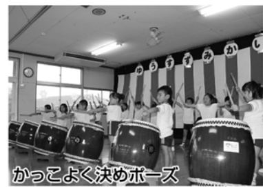
かっこよく決めポーズ