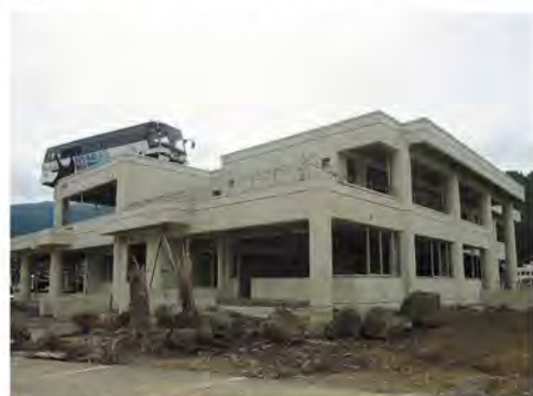
公民館に乗り上げたバス (宮城県石巻市)