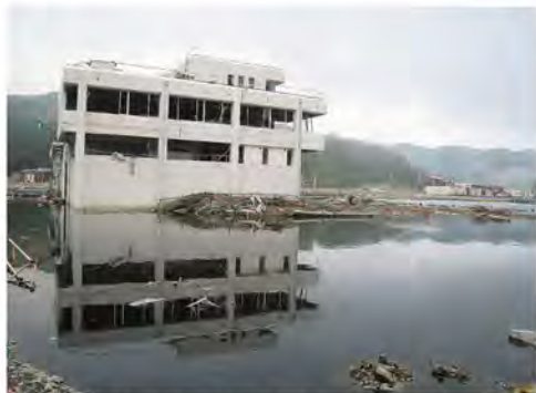
海水が引かず、地面は水に浸かったまま (宮城県女川町)