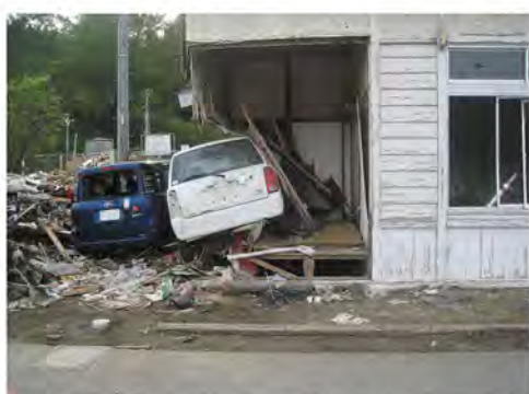
津波に流され家屋に突っ込んだ車 (宮城県気仙沼市街地)

それでも、ふるさとを愛し、 そこできん命に生きている人たちがいる。 ならば今、わたしたちに何ができるのだろう――