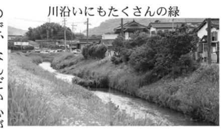
川沿いにもたくさんの緑

反射してちよつと眩しいくらい。普段はなかなかに歩くと景色を眺めることがないので、なんだか心が落ち着きます。自然に癒やされたところで再出発。そのまますすむと、なんと！泌泉に到着しました。