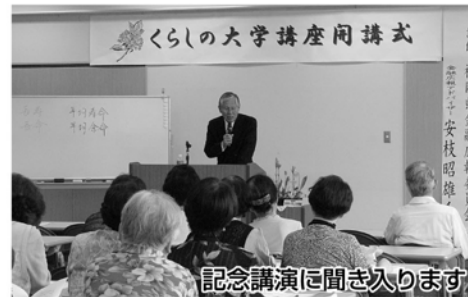
記念講演に聞き入ります

平成23年度くらしの大学講座(受講者59人)の開講式が6月11日に町民会館で開催されました。