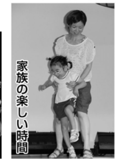
家族の楽しい時間