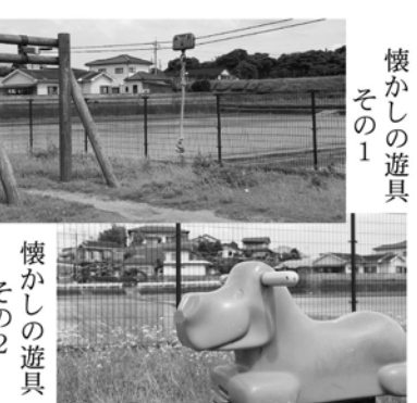
懐かしの遊具 その1

「美味しーいお米をたくさん作るために毎年欠かさないんだよ」と語ってくれました。最近、農業だけでなく様々な分野で機械に頼ることが多いですが、やっぱり最後の仕上げには人の手が欠かせないということでしょう。今年の田植えは、秋には立派な稲穂をきつとつけてくれるでしょう。