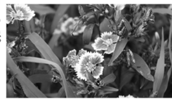
ほんとは何という花でしょう？

青々とした木々に照りつづける太陽、アスファルトの陽炎も立ちのぼり、いよいよ夏本番を迎えようとする今日この頃。みなさんいかがお過ごしでしょうか。暑いとどうしてもだんだん暑く感じますが、そんな気分を吹き飛ばすよう今日も一人旅(?)に出かけます。