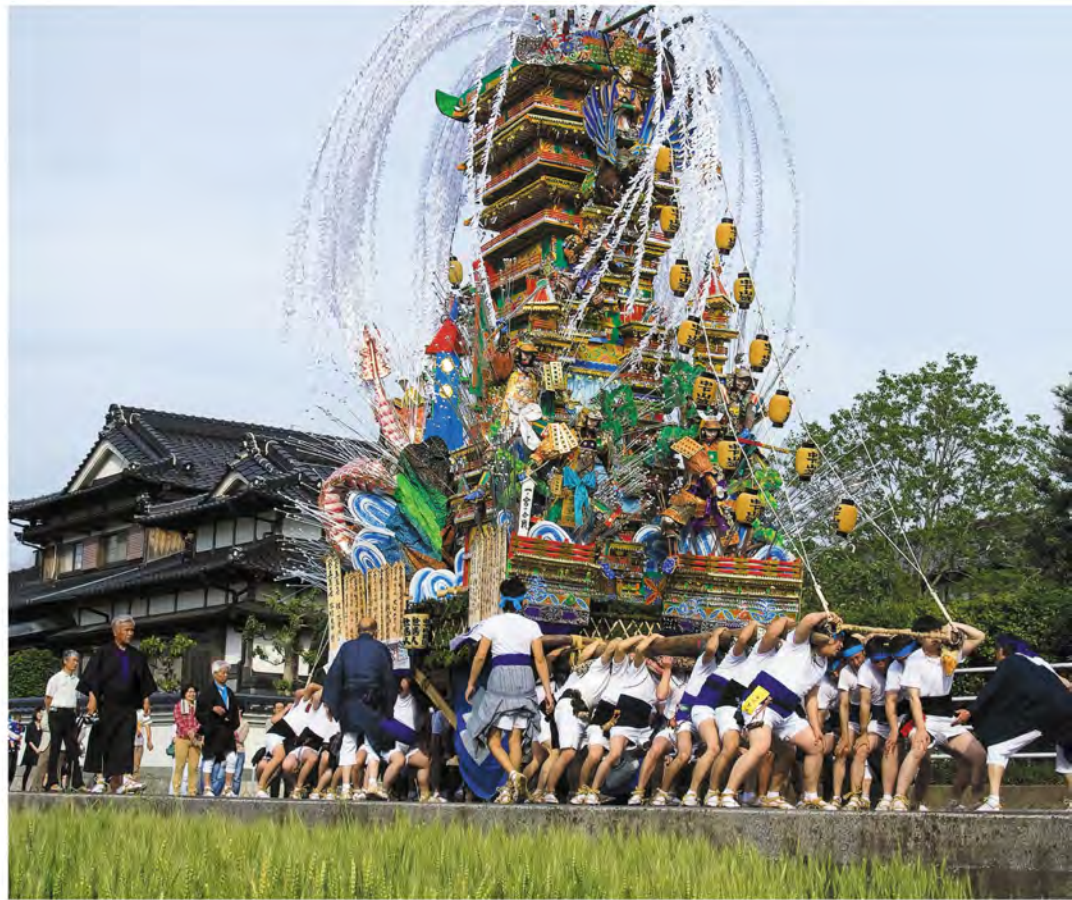
大賞作品「麦畑と山笠のある町」

残念ながらすべての入賞作品を掲載することはできませんが、住民センター1階で11月初旬まで展示していますので、ぜひ見てください。あの日の感動がよみがえります。