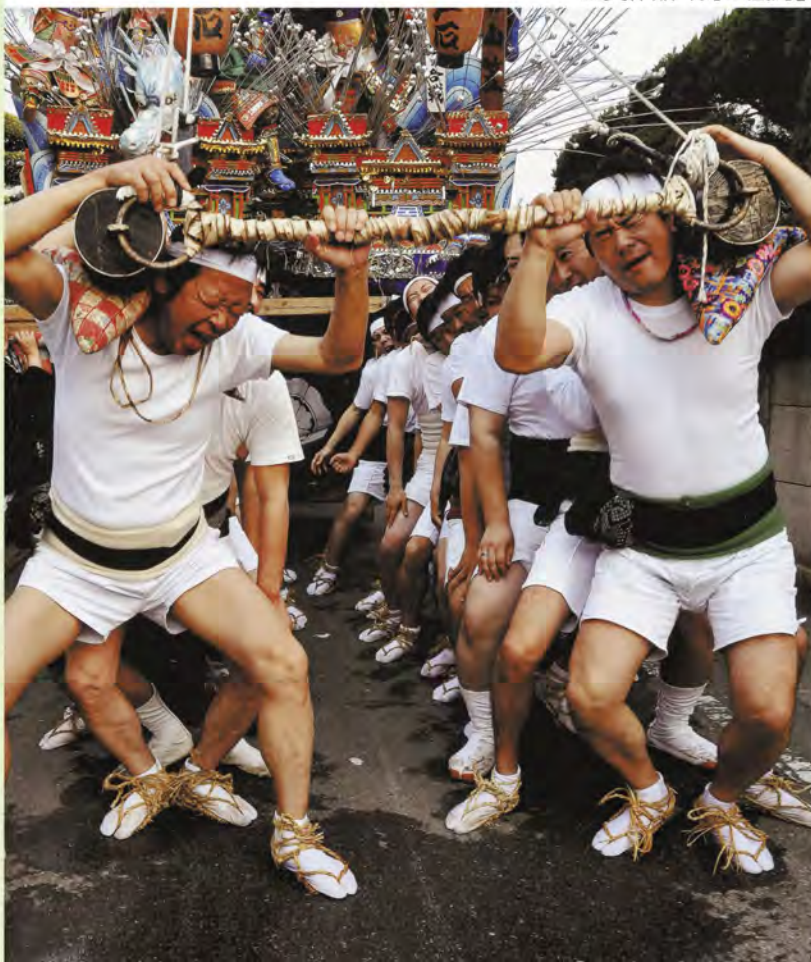
金賞作品「男の底力」