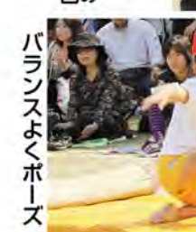
バランスよくポーズ