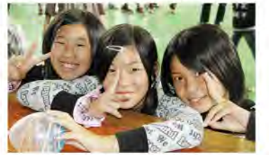
まつりで一層仲良しに