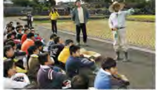
指導に熱が入ります