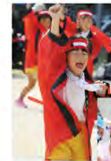
元気いっぱい! キッズソーラン