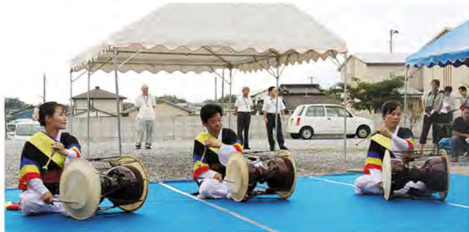
韓国の芸能太鼓が 演奏されました