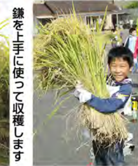
鎌を上手に使用して収穫します