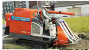
コンバインの登場に子どもたちは大歓声