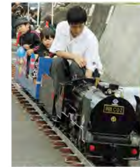
本格的なミニSLに大満足