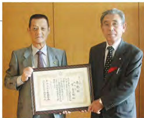
受賞報告に来庁されました

最後に、「これからは、若い人たちがこうした活動の中心となっていくことを願っている」と次代へのエールを送ってくれました。町の発展には、安心して暮らせる環境作りが必要です。みんなにとって心やすらぐ糸田町となるよう、より一層地域の連携を深めていきましょう。