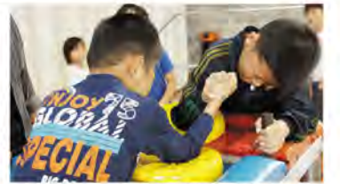
お互い全力をぶつけます

まつりの締めくくりでは福引きがおこなわれ、みんなドキドキしながら自分の番号が呼ばれるのを心待ちにしていました。当たった人もそうでない人も、みんな笑顔で過ごせた休日でした。