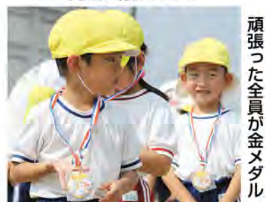
町立保育所の風景