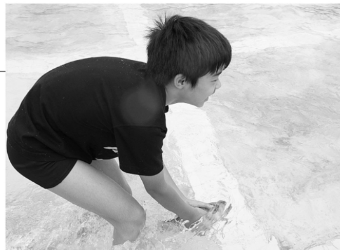
後ろからそっと捕まえて

子どもたちは、プールに放されたおよそ470匹の魚を見て、大会前から大興奮。つかみ取りが始まると、魚のすばしっこい動きに苦戦していましたが、笑顔で後を追うその姿は生き物との交流を楽しんでいるようでした。