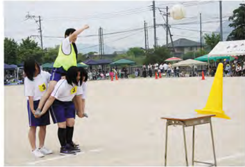
よおく狙って... そりゃっ