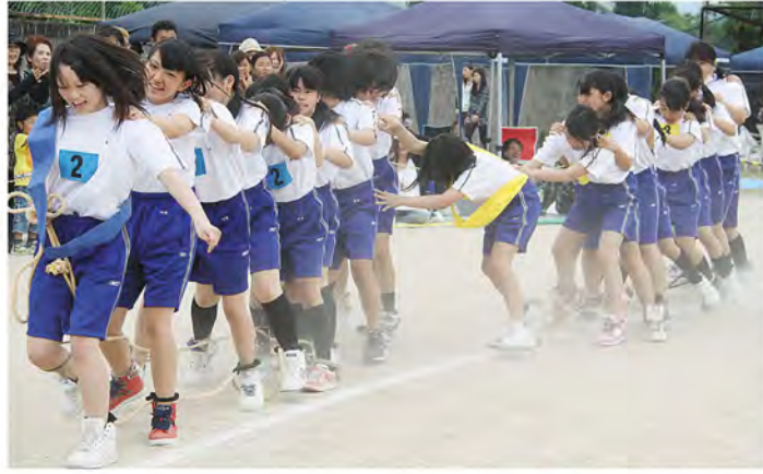
うわっ、足がもつれちゃう

全学年女子による「糸中ソーラン」では、手作りの衣装に身を包んだ3年生が中心となってさわやかなソーランを披露。アンコールでは大漁旗も登場し、より華やかな演技で会場を沸かせました。また、力強いエッサッサの掛け声やキビキビとした組体操が魅力の「糸中魂」が、男子全員でおこなわれました。技を決めるごとに難易度が増す組体操のラストを飾る7段ピラミッドは、一度は失敗したものの諦めずにチャレンジして2回目で見事成功！観客からは惜しみない拍手が送られました。