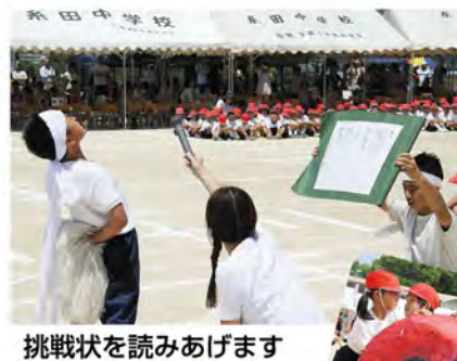
挑戦状を読みあげます