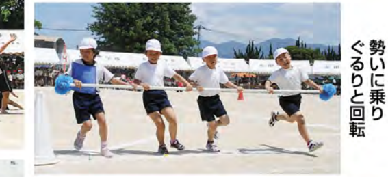
勢いに乗り ぐるりと回転