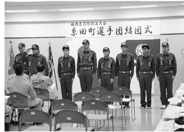
町の代表としての決意新たに

第22回福岡県消防操法大会糸田町選手団結団式が町民会館で5月15日に挙行されました。今年糸田町が田川郡の代表で県大会へ出場することになり、出場選手8人は、消防団が大会へ向け一丸となることを誓いました。操法大会とは、消防団員の消防技術の向上と士気の高揚を図り、消防活動の充実に寄与することの目的をもって、その技能を競い合うものであり、住民の生命財産を守るための基本が操法技術です。 9月9日(日)の大会本番まで約4か月間、仕事が終わった後で厳しい消防操法訓練が実施されます。苦しい訓練が続きますが、糸田町、そして田川郡の代表として、頑張っていたいただきますので、みなさんの応援をお願いします。