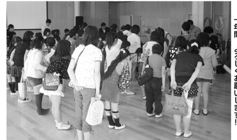
一年間、よろしくお願ひします!!

今年で10年目の節目を迎える「土曜サークル」ですが、これからも子どもたちがやってみたいことや興味や関心のあることにじっくりと取り組み、積極的に活動して欲しいですね。