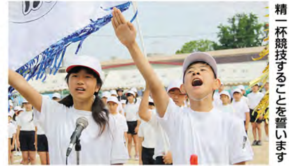
精一杯競技することを誓います