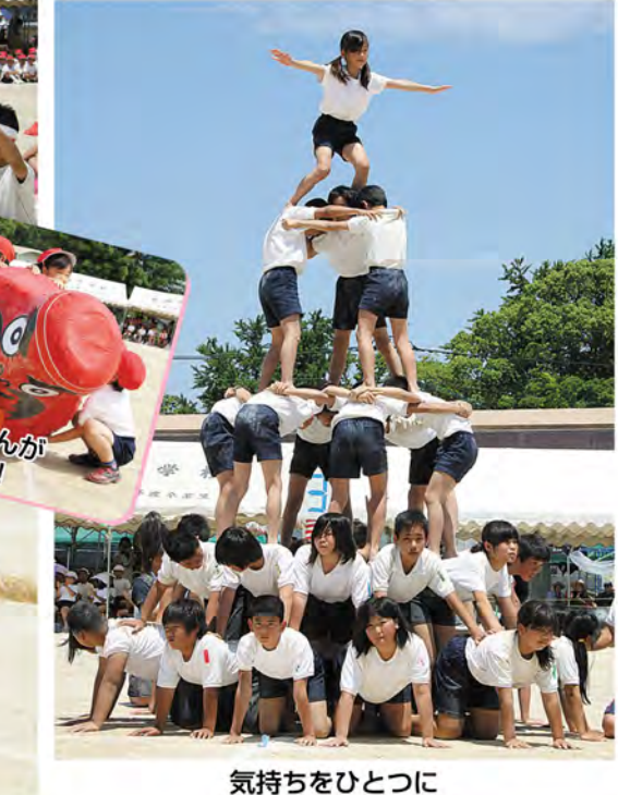
気持ちをひとつに