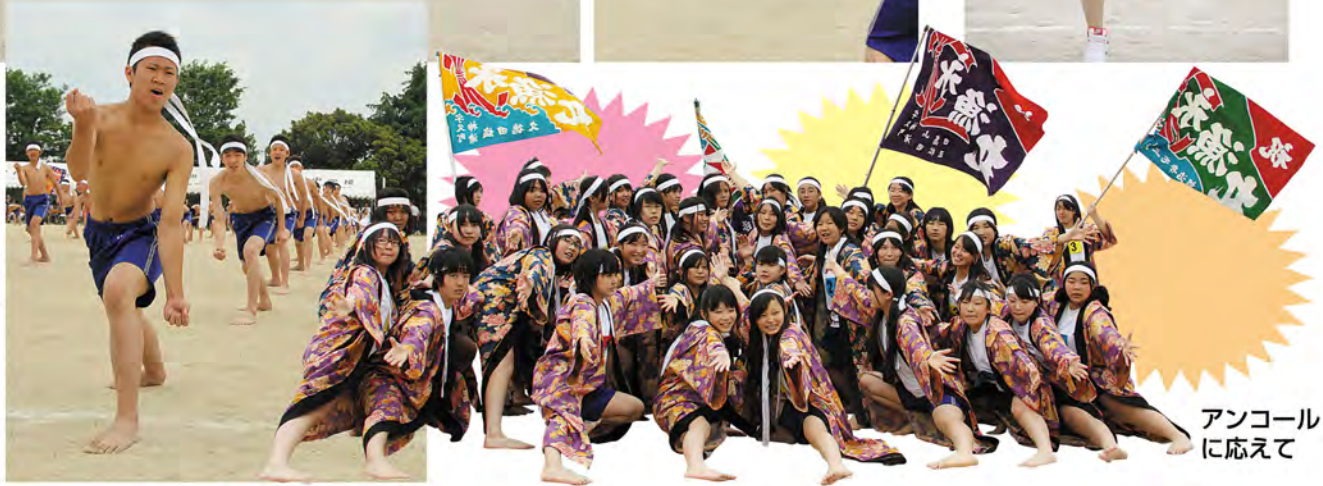
アンコールに 応えて