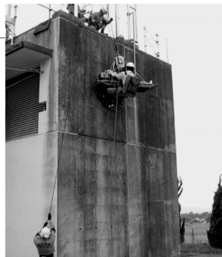
山岳事故を想定した訓練をおこなっています

田川地区消防署では、心肺停止などの重篤な登山者を救助する器具の有用性を検討しており、9月8日に飯塚市で開催される「福岡県救急医学会」で研究発表をおこないます。 英彦山と福智山を管轄に持つ田川地区では、年間を通じて山岳事故が県内トップクラスで発生しており、より多くの命を救い一人ひとりの安心・安全を守るため、日々たゆまない訓練や研究を積み重ねています。 もうすぐ秋の行楽シーズンを迎えます。事故などに気を付けて楽しい1日を過ごしましょう。