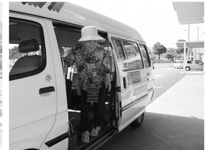
ゆっくり買い物を楽しんでください(^ ^)