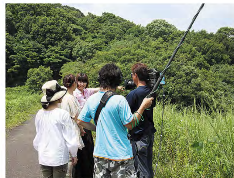
出ヶ浦ため池でロケスタート