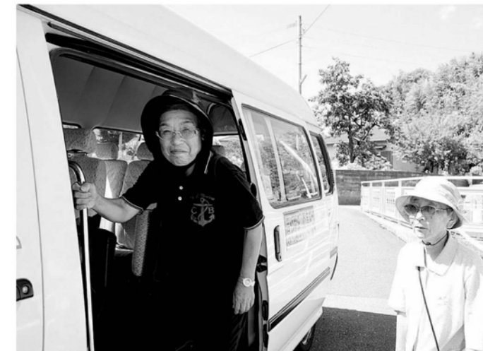
にこやかにバスへ乗り込みます

なお、9月から道の駅いとだの定休日(毎月第2水曜日)がなくなります。買物バスもあわせて運行しますので、どうぞご利用ください。