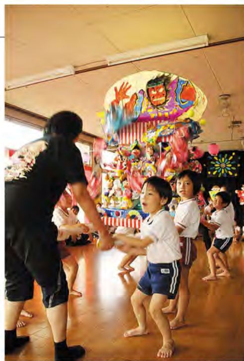
灯りのともった山笠が躍動