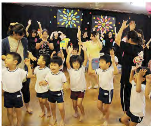
さあ、みんなで踊ろう♪

山笠披露会は手話を交えた元気な歌から始まり、息の合った太鼓演奏や色とりどりに飾りつけられた山笠の披露など、終始活気にあふれていました。最後は保護者も一緒に輪になって踊り、楽しい夏のひとときを過ごしました。