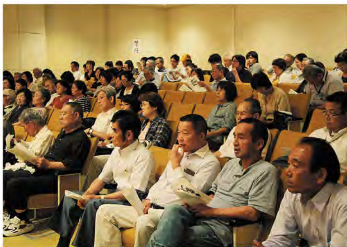
真剣に聴き入ります