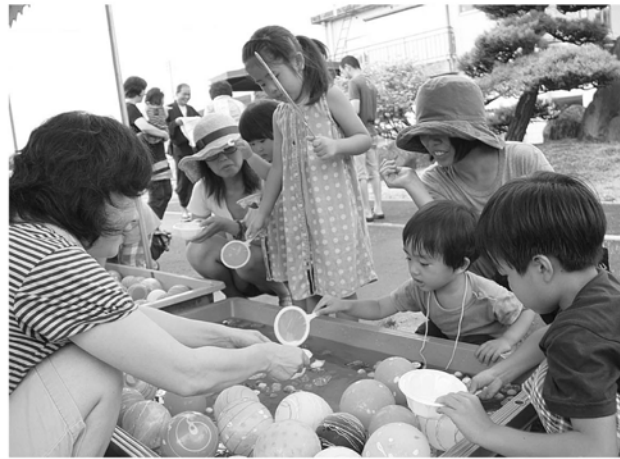
上手にすくえたかな？

今年も多くのおど自慢たちが美声を披露したカラオケ大会に始まり、盆踊りでは大人も子どもも輪になって炭坑節などを踊りました。縁日ではかき氷やわたがしの出店やヨーヨーつりなどがおこなわれ、子どもたちにはキンギョやメダカが配られました。祭りには近くのグループホームからも多くの方が足を運び、恒例となった夏祭りを楽しんでいたようです。祭りの最後は花火で締めくくられ、明るい夜空に子どもたちの笑い声がいつまでもこだましていました。