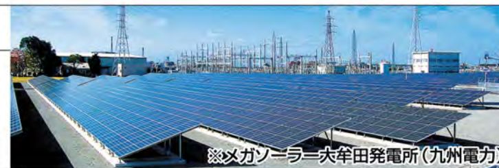
※メガソーラー=六牟田発電所(九州電力)

定格出力が1メガワット(1,000キロワット)以上の太陽光発電、またはその施設のこと。発電所建設には広大な用地が必要だが、再生可能エネルギーの基幹電源として期待されている。