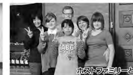
ホストファミリーと