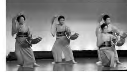
※写真は昨年の風景です。