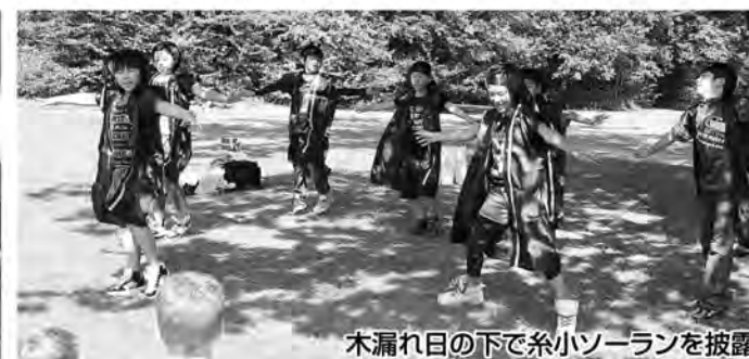
木漏れ日の下で糸小ソーランを披露