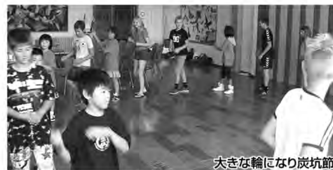
大きな輪になり炭坑節