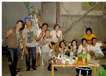
ホームステイの家族とおいしいバーベキュー