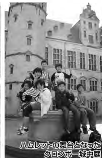
ハムレットの舞台となったクロンボール城中庭