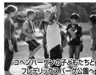
コペンハーゲンの子どもたちとフレデリクスバーグ公園へ