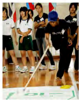
高校生とともに ニュースポーツを体験