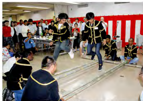
バンブーダンスで軽やかにステップ

40年間で46の国と地域から538人もの研修生たちを受け入れた振興会の歴史は、これを機会に50周年へと向けて大きく前進することでしょう。