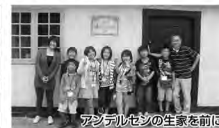
アンデルセンの生家を前に