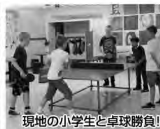
現地の小学生と卓球勝負!