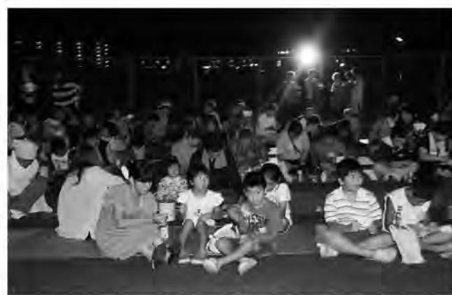
早くビンゴにならないかな

9月1日に真岡行政区が福智高校グラウンド駐車場で納涼祭をおこない、子どもから大人まで多くの人々が集まって夏の終わりを楽しく過ごしました。