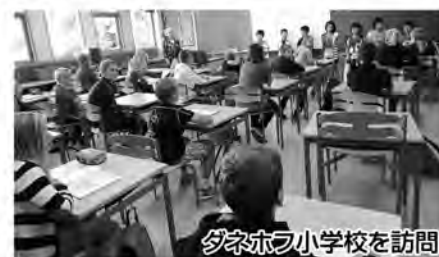
ダネホフ小学校を訪問