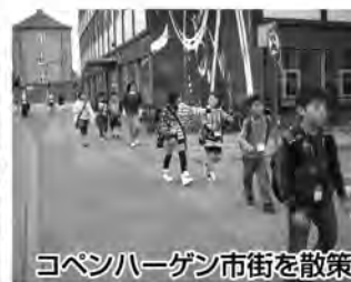
コペンハーゲン市街を散策