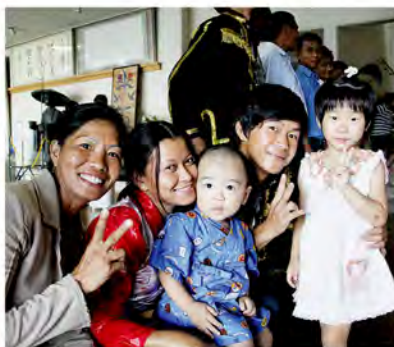
チビッコもしっかり交流