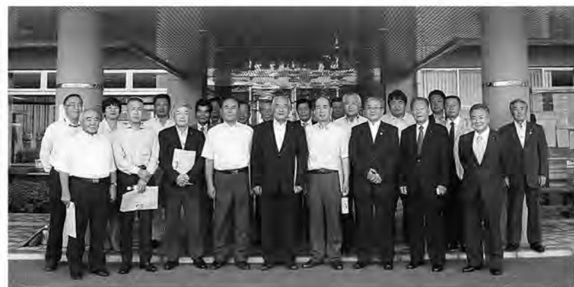
南三陸町と糸田町両議員団

東日本大震災で被害を受け、今年6月の糸田町議員団による現地視察研修を受け入れていただいた宮城県南三陸町の議員団から、8月23日に表敬訪問を受けました。南三陸町では復興に向けた計画を進めています。必要なものはマンパワー(人・知識)とのことでした。主要な産業だった漁業や農業をはじめ、生活環境の一日も早い復旧を願い、かつてのにぎわいが戻ることを祈念します。