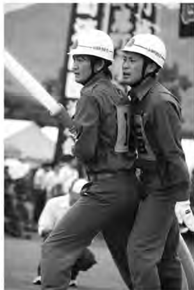
真剣な眼差しで操法に臨みます

大会は終わりましたが、町の安全を守るため、ここで培った技術を今後の消防活動で活かしてくれることでしょう。