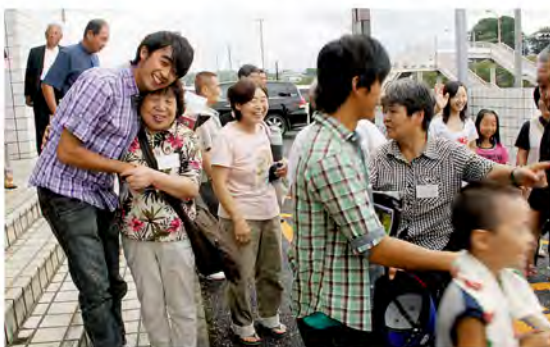
名残惜しい別れのとき