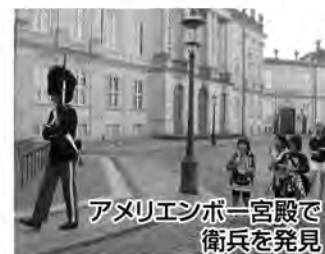
アメリカンボーイ宮殿で衛兵を発見