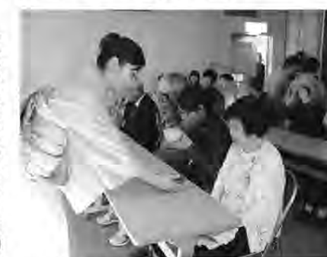
味わい深いお茶が振る舞われます

中秋の名月にあたる9月30日、文化会館で観月会が厳かにおこなわれました。台風接近のため、あいにくの曇り空ではありましたが、ときおり雲間からのぞく満月に心癒やされる会となりました。茶席では薫り高いお茶やかわいらしいウサギの茶菓子が振る舞われ、美しく響き渡る声楽や