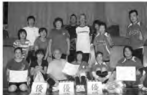
各パートで優勝した皆さん

Aパート優勝…中糸田Bチーム Bパート優勝…SBチーム Cパート優勝…大熊他合同チーム