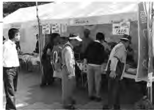
糸田のブースにも多くの人を訪れました

10月7日、福岡市の天神中央公園に筑豊地域全15市町村の34団体(35ブース)が集結し、筑豊フェアが開催されました。筑豊のイメージ向上や交流人口の増加などを目的としておこなわれるこのフェアでは、それぞれの地域の名物料理や特産物を売り出してその魅力をアピール。糸田町からは「糸田ふれあい市」が、新鮮な野菜や弁当、一銭焼きを販売し、大盛況のもとイベントを終えました。また、今年は筑豊地域のゆるキャラが集合し、会場を盛り上げていました。