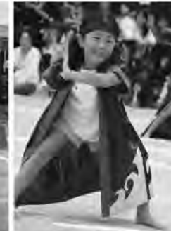
踊りも衣装もダイナミックに

さわやかな秋晴れの空の下、天馬保育園では10月6日に園庭で、東西の町立保育所は町民グラウンドで10月7日にそれぞれ運動会がおこなわれました。