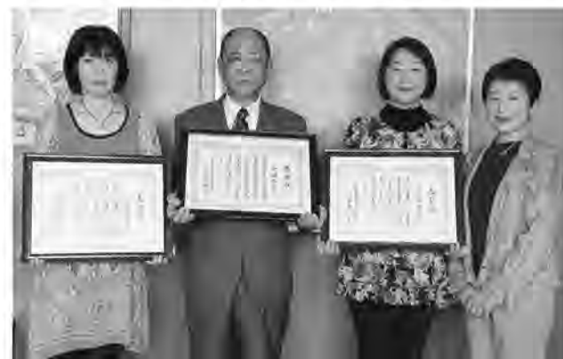
活発な教育活動に日々まい進しています

永年にわたり社会教育行政に貢献した3人の社会教育委員が、平成24年度福岡県社会教育委員功労者表彰を受け9月25日に報告のため役場を訪れました。