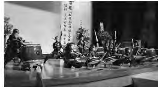
力強い演奏で式を盛り上げました