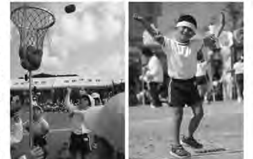
上手に入るかな? 炭坑節でさのよいよい!

最後まで全力で走り抜けたかけっこや、大きく飛び跳ねながら入れた玉入れ、かわいらしい衣装でのびのび踊ったダンスなどに、訪れた保護者たちは笑顔でシャッターを切ります。また、園児と保護者が一緒に参加した競技では、勝ち負けよりも親子のふれあいや我が子の成長を楽しんでいたようでした。