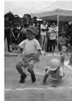
ダイビングヘッドでゴール!