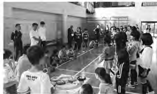
見慣れないゲームに興味津々

下田川地区子ども会育成連絡協議会主催の「下田川子ども会親善スポーツ大会」が、下田川ライオンスクラブ・糸田町教育委員会・福智町教育委員会の後援で、9月23日に開催されました。毎年おこなわれている糸田町と福智町の交流行事で、本年度はニュースポーツのカーリングを町民体育館でおこないました。糸田町からは4地区11チーム行越・西部・桃山・北区)が参加。体育館中に歓声が響き渡り、大変盛り上がる試合となりました。また、初めて会った福智町の子どもたちと仲良くカーリングを楽しんでいる姿がとても印象的でした。結果は次のとおりです。