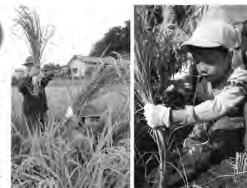
刈ったぞ~!! ケガしないよう慎重に

今回収穫した米は、小学校では調理実習で、保育所では誕生会などで美味しくいただく予定です。田植えや収穫、食事を通じ、食の大切さをかみしめて欲しいですね。