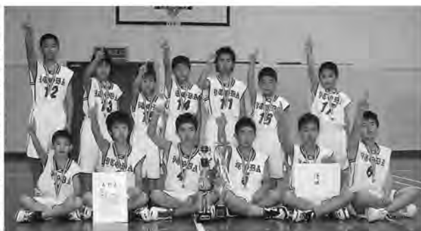
目指せ、ナンバーワン!!