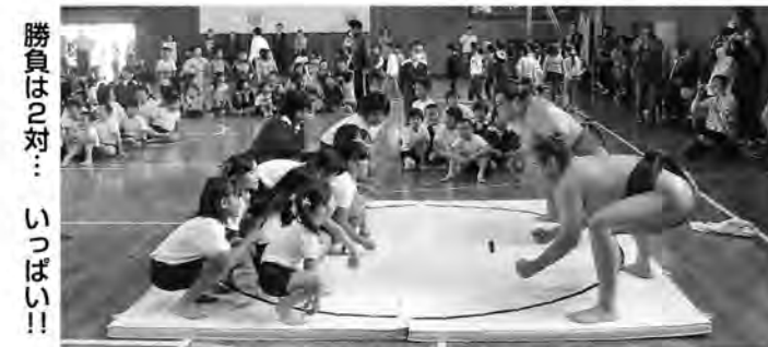
勝負は2対1... いっぱい!!

10月30日、貴乃花部屋の力士を迎えて糸田小学校3年生の親子レクリエーションがおこなわれました。