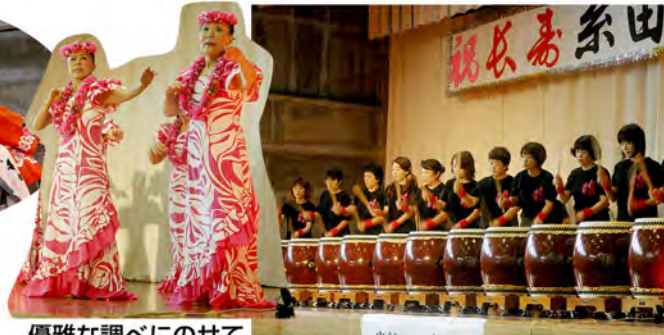
優雅な調べにのせて