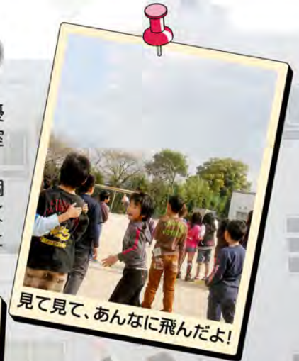
見て見て、あんなに飛んだよ!

3年生児童全員が参加し、大型紙芝居「みんなともだち」で一人ひとりの個性や命の大切さを学びました。また、5月に植えたひまわりの種を紙風船にくくりつけ、みんなで一斉に飛ばしました。大空へ自由に高く舞い上がる風船とともに、人権を大切にすることもより大きく広がったことでしょう。