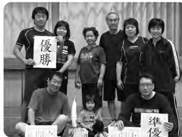
Aパート優勝 上糸田

〔大会結果〕 ◆Aパート 優勝 上糸田 準優勝 真岡 3位 宮川二 ◆Bパート 優勝 宮川一① 準優勝 上糸田 3位 大熊・宮床団地合同