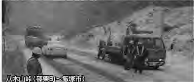
八木山峠(篠栗町~飯塚市)

国土交通省北九州国道事務所管理の国道201号八木山峠・鳥尾峠では、積雪・凍結により、立ち往生あるいはスリップ事故を起こし大渋滞を引き起こすケースが度々発生しております。 事前に冬用タイヤやチェーンを準備していただき、下記ホームページなどにより道路情報を収集したうえで通行していただきますようお願いいたします。 ◆国土交通省北九州国道事務所 パソコン http://www.qsr.mlit.go.jp/kitakyu/ 携帯 http://www.qsr.mlit.go.jp/kitakyu/m/ ◆問合せ 国土交通省九州地方整備局 北九州国道事務所 筑豊維持出張所 電話0948-22-7942