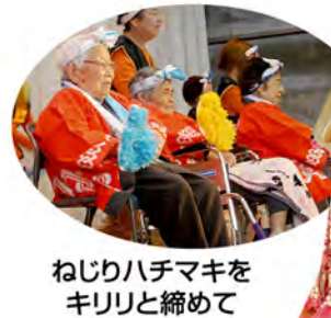
ねじりハチマキをキリリと締めて