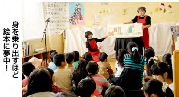
身を乗り出すほど絵本に夢中!

このほかにも、ブックラリー表彰式、ブックリサイクル、一般利用者の作品展示などがあり、多くの人が訪れていました。