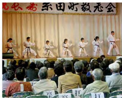
ビシッと決まった動きに感嘆の声