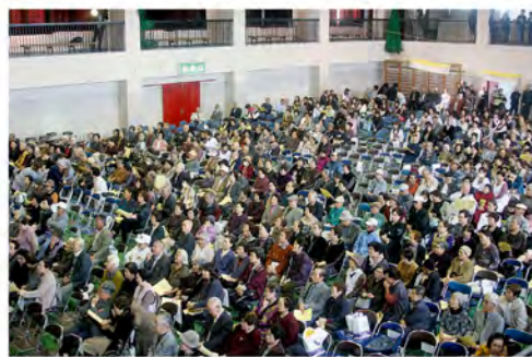
今年も多くの人が集まりました