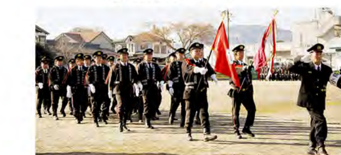
※町民のみなさん、消防団員の勇姿をぜひご覧ください。