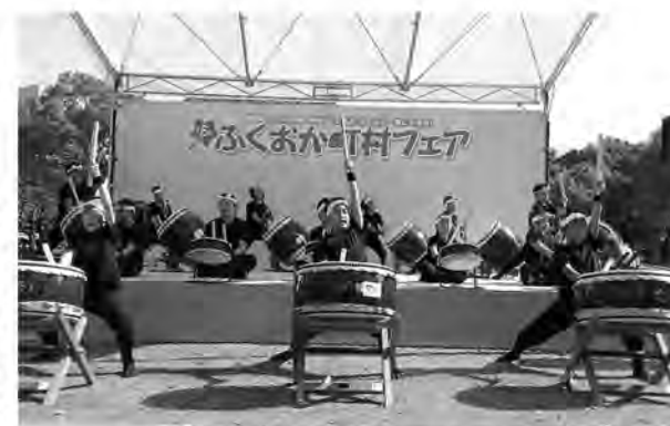
福岡のど真ん中に太鼓の音が響きました

県内さまざまな町村から集まった特産品の販売やご当地自慢のパフォーマンスで、両日ともに大盛況。糸田町からは「和太鼓たぎり」がステージイベントに参加し、迫力ある演奏で会場を圧倒していました。