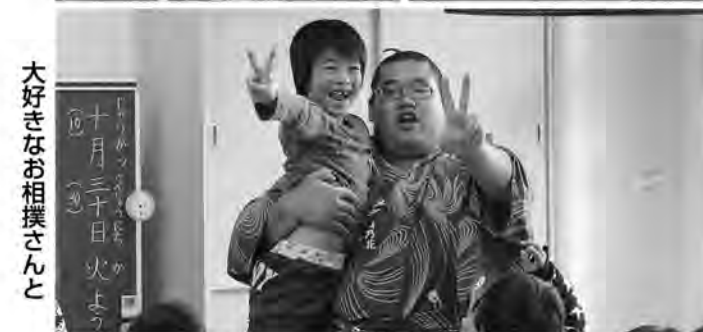
大好きなお相撲さんと

強く優しい力士のみなさんとの交流は、子どもたちにとって貴重な経験になったことでしょう。