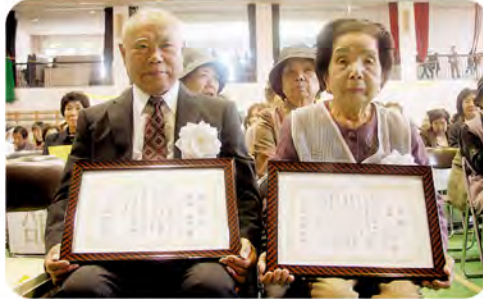
お祝い状を手に。おめでとうございます(^_^)

式典の部では、今年めでたく80歳、90歳を迎える人のそれぞれの代表者にお祝い状が贈られました。演芸の部では、心に響く歌や太鼓、優雅な舞踊にキリリと引き締まった空手の演舞などが披露され、会場中が笑顔と拍手で包まれました。これからも、温かい笑顔を絶やさずに長生きして欲しいですね。