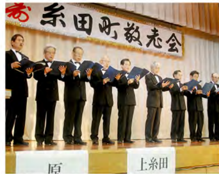
美しく響くテノールに酔いしれます