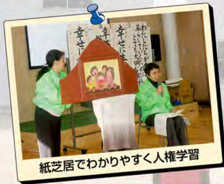
紙芝居でわかりやすく人権学習