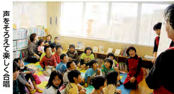
声をそろえて楽しく合唱