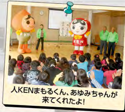
人KENまもるくん、あゆみちゃんが来てくれたよ!