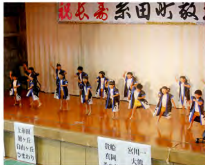
小さな体でステージいっぱいに躍動