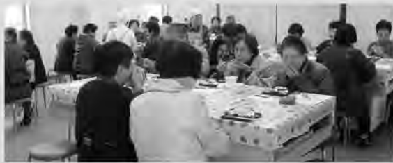
美味しい健康食は 大人気でした