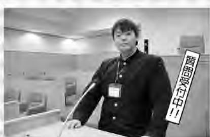
私が何でも答えます