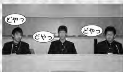
未来の町議会議員候補です

仕事を終えた生徒たちからは「仕事の大変さが分かりましたが、そこに楽しさもありました」という声を聞くことができました。この職場体験で、貴重な経験を積むことができました。