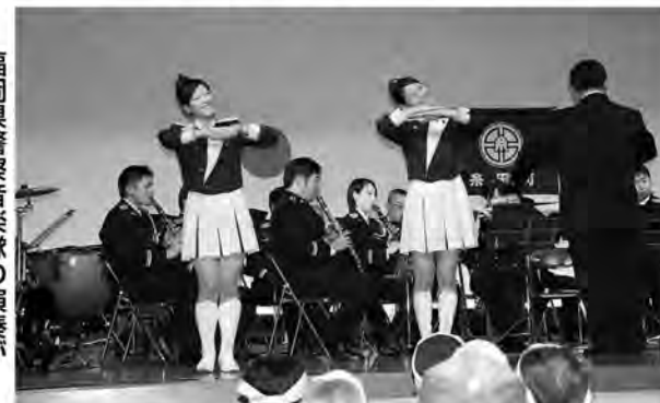
福岡県警察音楽隊の演奏が会場中を魅了

暴追宣言・決議事項が採択され、力強いシュプレヒコールの後、参加者全員で暴追パレードを実施しました。この大会が、暴力等を許さない、受け入れない、住みよく明るい町づくりのきっかけとなることでしょう。