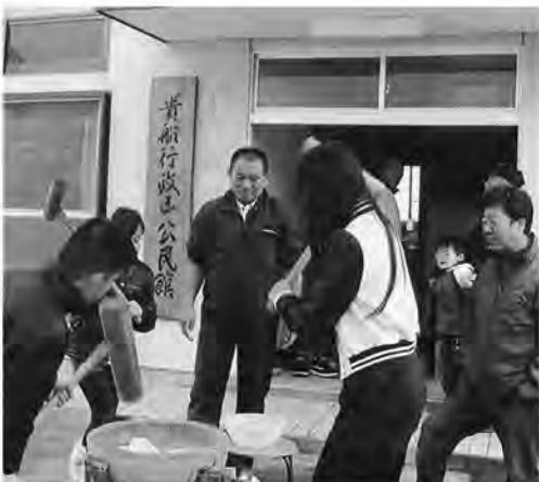
大人顔負けの杵さばき

12月2日、貴船行政区に暮らす親子三世代が公民館に集まり、もちつき大会がおこなわれました。力強くもちをつく大人に負けじと、子どもたちもしっかりした腰構えで杵を振ります。とり粉を飛ばしながら上手に丸められたモチは、酢もちやきな粉もちとなり、みんなを笑顔にしていました。