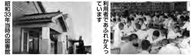
昭和33年当時の図書館 利用者があふれかっ ています

図書館について 今回ご紹介するのは、昭和33年9月に開館した図書館の風景です。玄関や書架の様子は昭和34年発行の「泌泉」に掲載されていました。図書館の閲覧風景は、昭和37年のもので多くの生徒が利用しています。非常に多くの利用があっびびっくりします。この頃は「あまり本を読まなかった」という話をよく聞きますが、系田町では昔から大変多くの人たちが熱心に読書などの教育環境を整備していたことがうかがえます。 現在の図書館は、平成15年4月に開館しています。本のみならず雑誌や音楽、映像資料などを取りそろえており、町内の人であれば誰でも利用することができるようになっています。