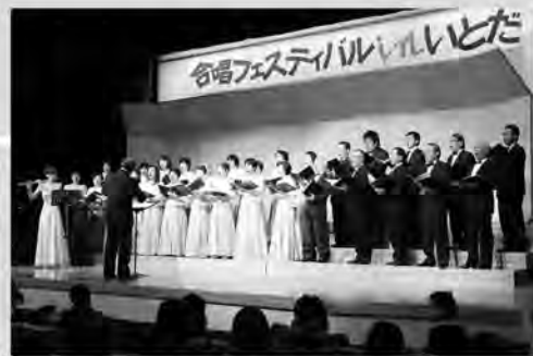
フルートと歌声が紡ぐ メロディ