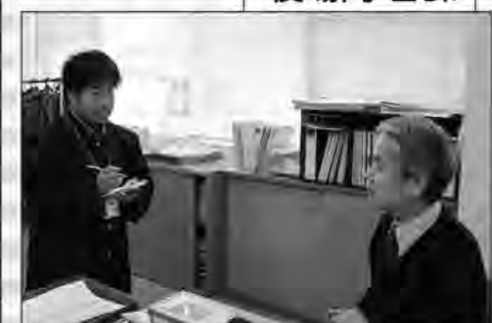
税務課長に取材をしている様子!!