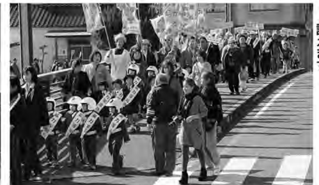
町内パレードで暴力追放を訴えます