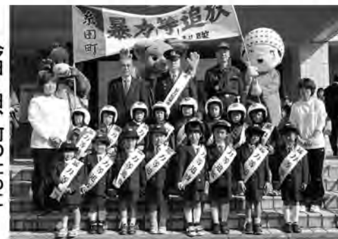
今日1日、町のために頑張ります！

暴力・暴力団・犯罪、いじめなどの暴力等追放への関心を高めるため、第23回糸田町暴力等追放町民大会が11月18日に文化会館で開催されました。大会にはおよそ350人の町民のみなさんが参加し、あらゆる暴力追放の決意を新たにしました。