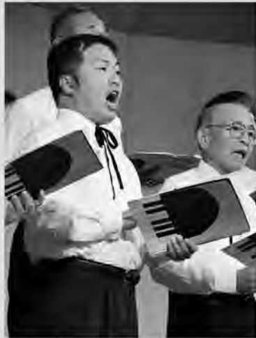
力強い歌声が響きます

12月2日に文化会館で「第22回合唱フェスティバルinいとだ」が開かれました。糸田小・中学校をはじめ、町内外から参加した11団体の美しいハーモニーに、訪れた人たちは目を閉じて酔いしれました。最後は観客も一緒に閉じて酔いしれました。一体感あふれるフェスティバルとなりました。いつまでも澄みきった歌声が響き合う糸田町であって欲しいですね。