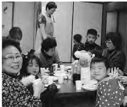
前日からの準備、お疲れ様でした おかげで美味しいもちができました(^_^)