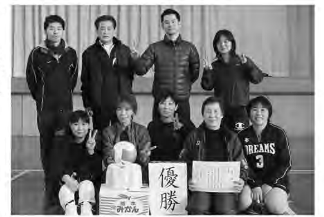
混戦を制して優勝をつかみました