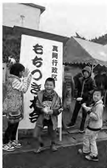
美味しいもちにはじける笑顔