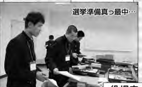
選挙準備真っ最中...