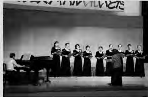
透明感のあるハーモニーが 届けられました