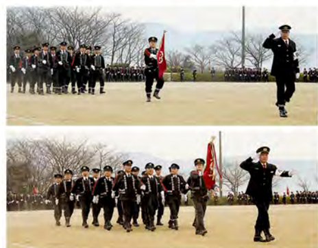
この分団も隊列を乱さず行進します