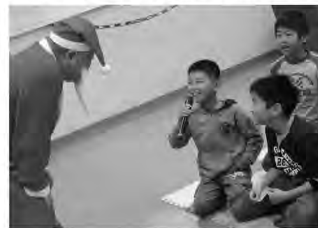
ねえねえ教えてサンタさん