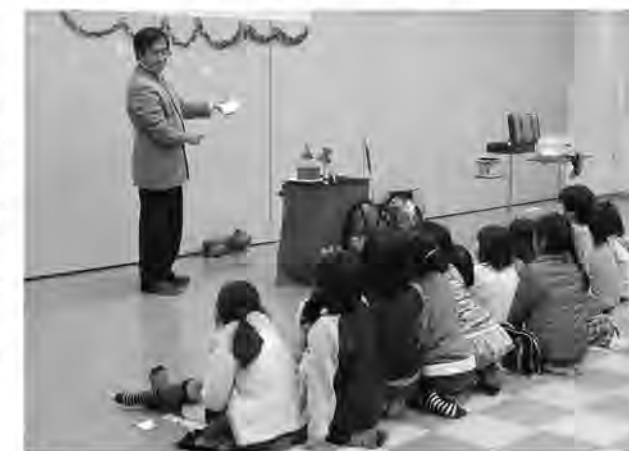
次はどんなマジックかな?