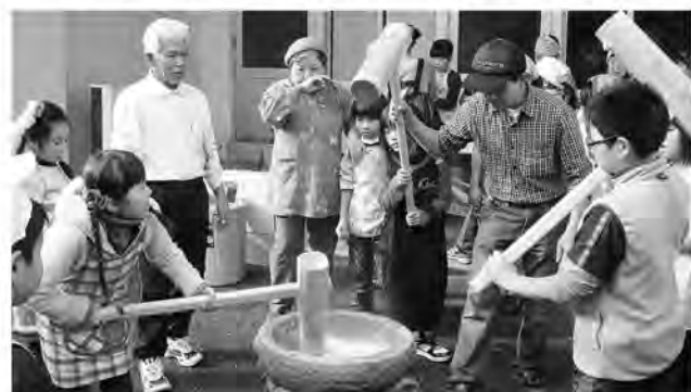
上手につけるかな？

餅をつき終わると、食生活改善推進会が作ったおにぎりや豚汁と、自分たちでついた餅を美味しく食べていました。終了後は、余った餅をみんなで分けて持って帰りました。