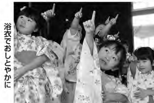
浴衣でおしとやかに

だんだんと寒さが厳しくなる中、生活発表会が12月8日に西保育所で、15日に東保育所でそれぞれおこなわれ、子どもたちは成長した姿を保護者に披露しました。