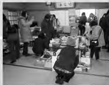
お気に入りの一品は見つかりましたか？