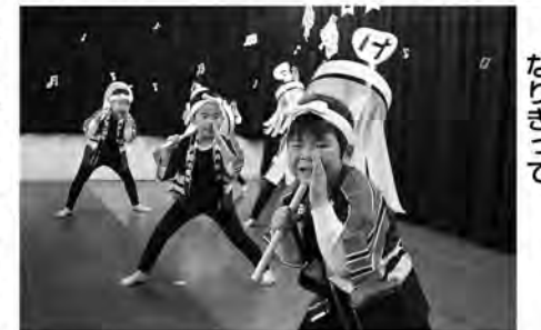
かっこいい火消しになりきって