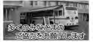
多くのみなさまの協力をお願いします

※1 65歳以上の人は、60歳から64歳までで最低1回は献血の経験がある人のみとなります。 ※2 この3日間に出血を伴う歯科治療(歯石除去を含む)を受けられた人、現在、病気が治療中で注射や服薬をしている人は献血することができない場合があります。