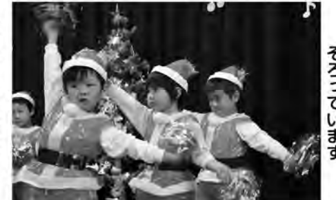
動きもバッチリそろっています