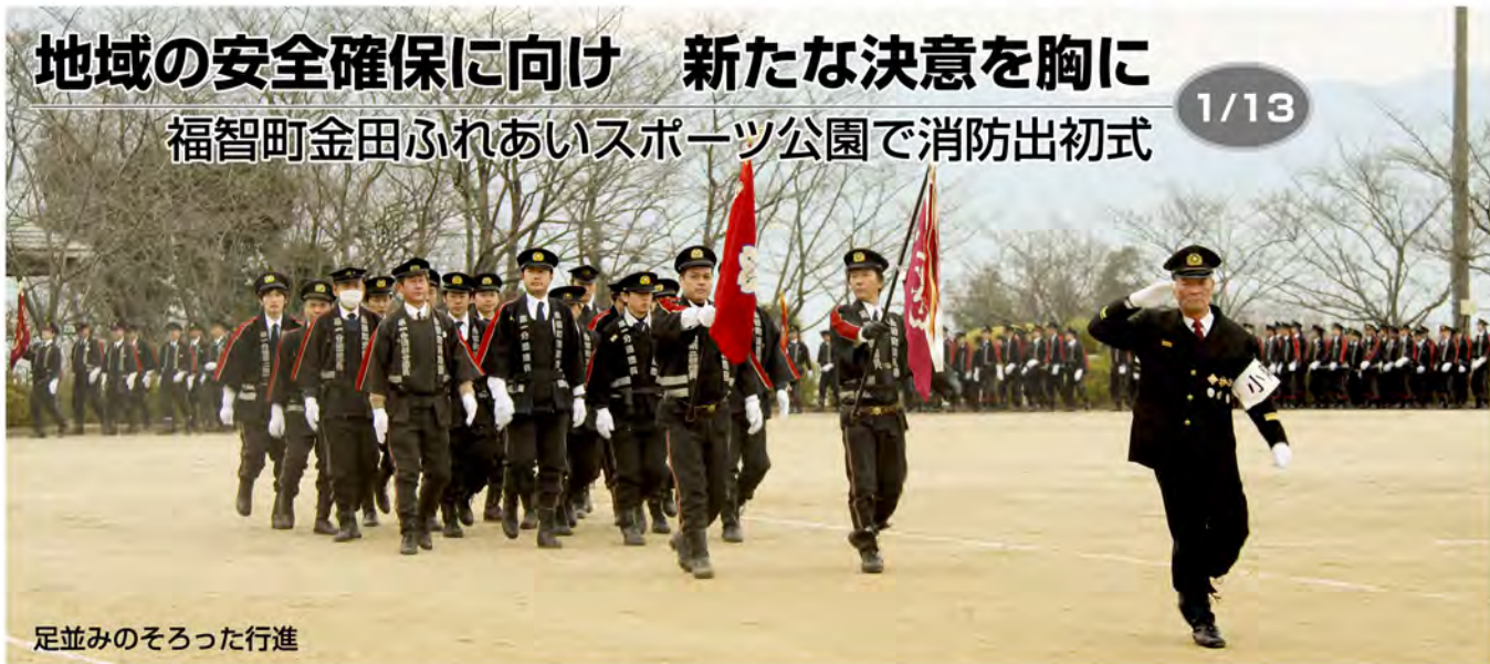
足並みのそろった行進

私たちの住む町を災害などから守ってくれる消防団が、1月13日に下田川ニヶ町連合消防出初式を規律正しく挙行了しました。