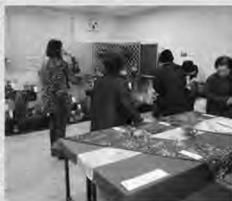
様々な作品が並びます

「いよいよとつてもだいすき祭」の一環である隣保館まつりが、12月8日、9日に隣保館でおこなわれ、子どもから高齢者までたくさんの方が来場しました。 写真やガーデニング、手話などの講座による展示や陶芸体験、節電コーナーなどさまざまなブースが設けられ、訪れた人を楽しませていました。9日のバザーは悪天候のため屋内での開催となりましたが、気に入った品物を手にとり笑顔を見せる多くの人でにぎわいました。また、冷え込みの厳しかった両日ともに豚汁やおしるこなどが盛況で、体の芯から温まっていました。