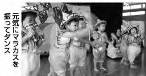
元気にマラカスを振ってダンス