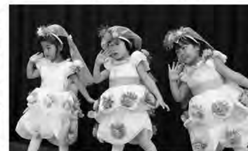
ドレスでにっこり