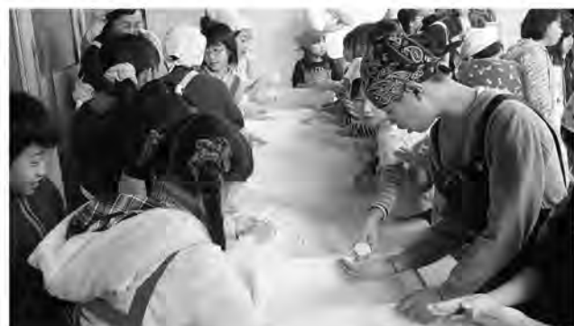
みんなで丸めます