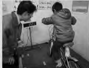
自転車をこいで発電しよう！