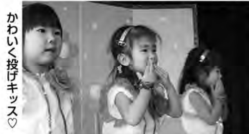
かわいく投げキッス♡