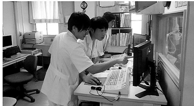
丁寧な指導を受けました