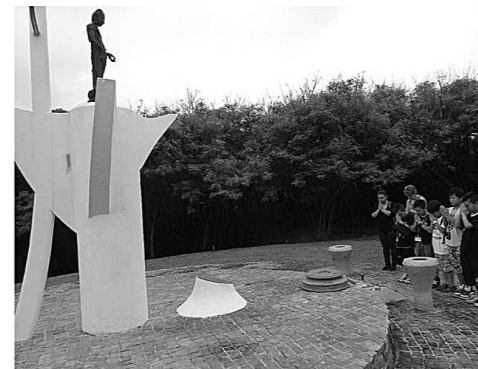
▲ スーサイドクリフ