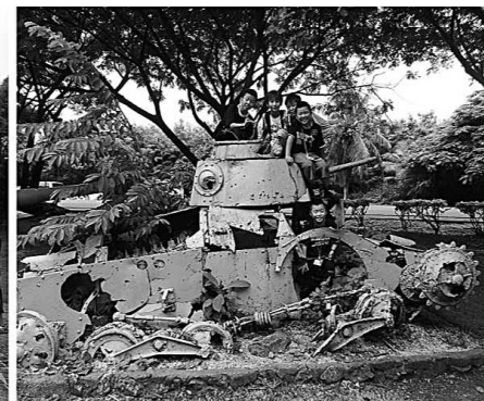
▲ ラストコマンドポスト