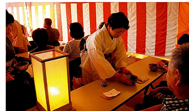
厳かな雰囲気なかで

掛け軸や生け花が飾られた1階ロビーでも多くの方が足をとめ、町の伝統文化を觀賞。茶席後恒例の抽選会では当たった景品を見せ合うなど、みなさん笑顔をこぼしていました。