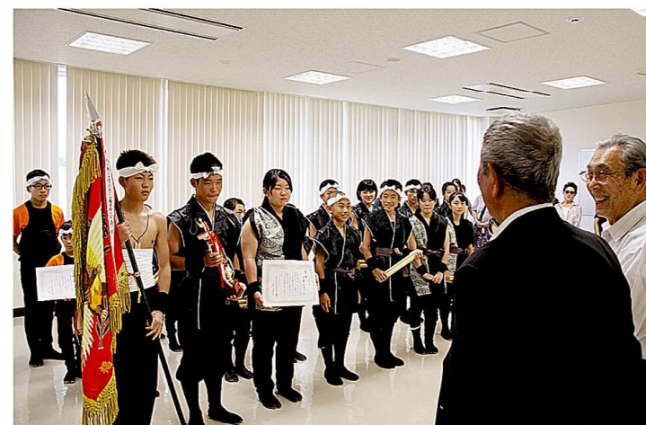
優勝旗を手にチームみんなで報告

全国大会に出場が決まった報告として、和太鼓たぎりが9月9日に役場へ表敬訪問をしました。9月7日にイヅカコスモスコンでおこなわれた、第15回日本太鼓ジュニアコンクールに優勝したことで、全国への切符を獲得した和太鼓たぎりに。来年3月に長野県で開催される全国大会に挑むため、日々厳しい練習を続けています。