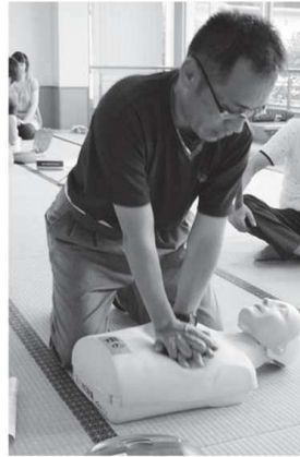
△ 圧迫は強く、早く、絶え間なく！

糸田町社会福祉協議会 糸田町社会福祉センター内(役場横) 電話26-4540 FAX26-3666