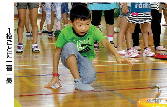
1投ごとに一喜一憂