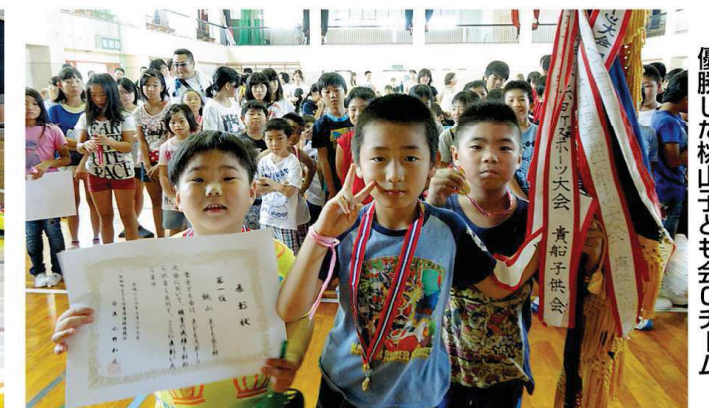
優勝した桃山子ども会Cチーム