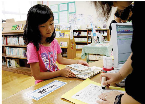
読書カードにスタンプを押してもらおう児童

平成23年度から小・中学校で導入されている「読書通帳」が子どもたちに好評です。読書通帳とは小学1年生～中学3年生の9年間、読んだ本の冊数を記録