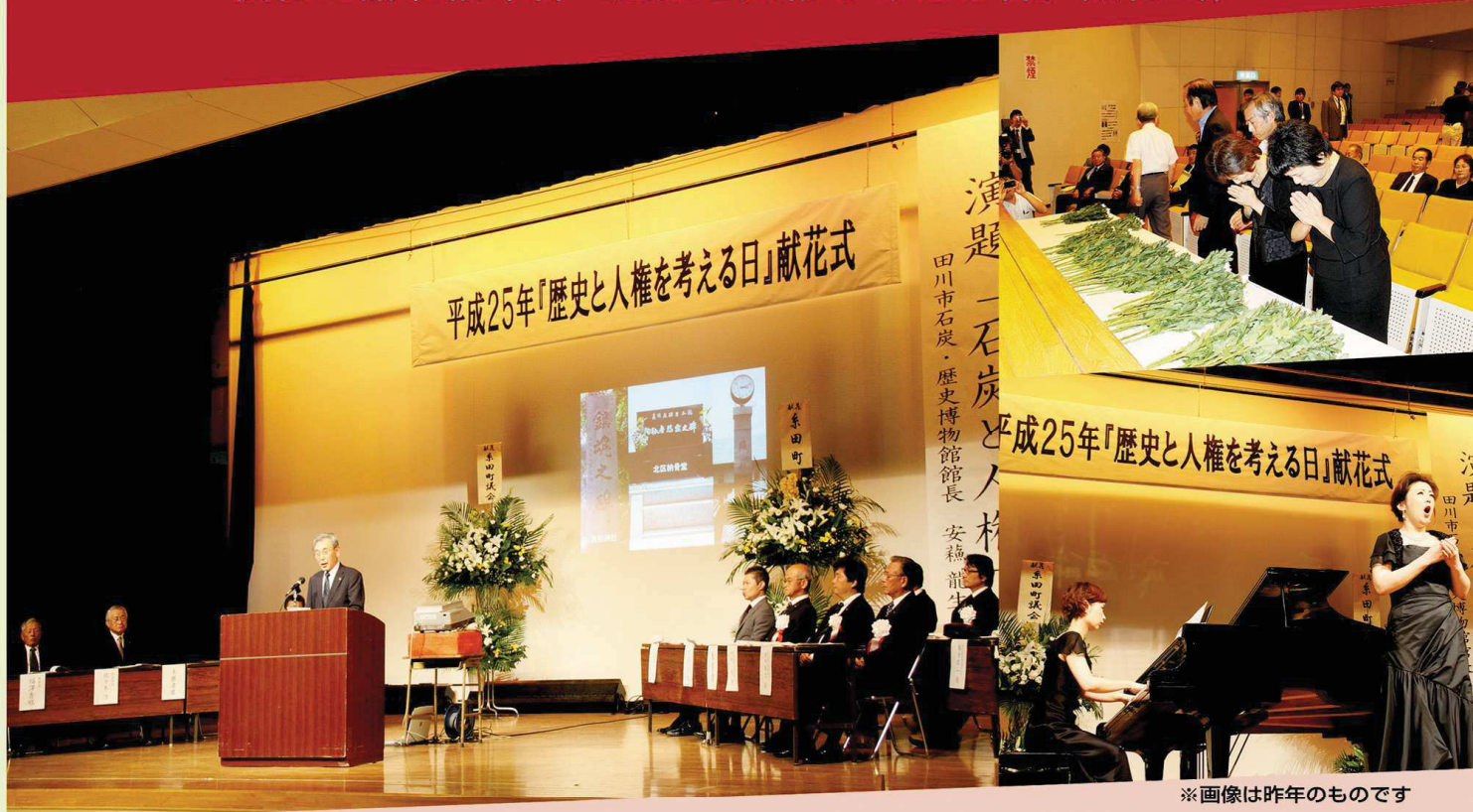
※画像は昨年のものです