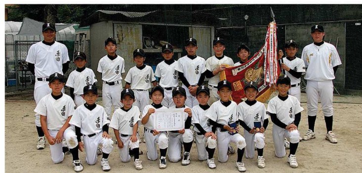
1人ひとりが持ち味を発揮