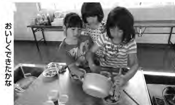
おいしくできたかな