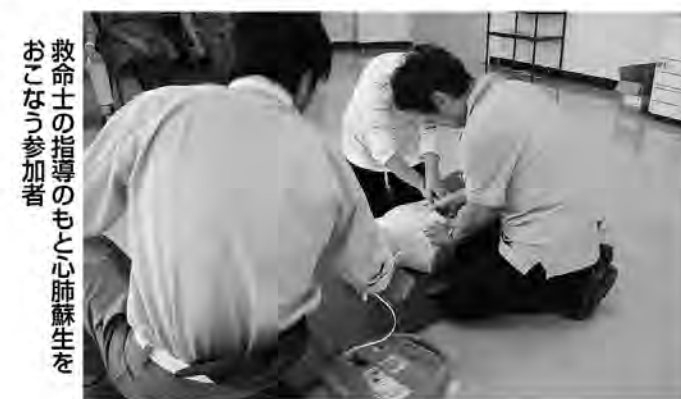
救命士の指導のもと心肺蘇生をおこなう参加者

少子高齢化の進む中、救命処置の仕方を学び地域の福祉活動にいかしていこうと、金田分署の救命士2人を招き、5月19日に住民センターで糸田町民生・児童委員協議会が救命処置についての学習会を実施しました。