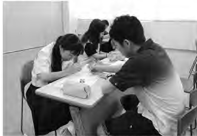
子どもたちのやる気に講師陣が応えます

※学力補充教室は対象学年の児童・生徒であれば随時受け付けます。詳細は担任の先生か教務課・学校教育係 電話26-3788まで問合せください。