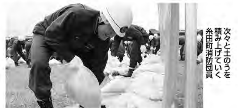
次々と土のうを積み上げていく糸田町消防団員