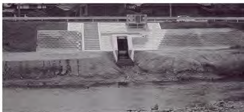
フローティングゲート設置