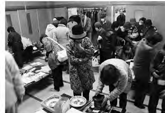
バザーで多くの人が掘り出し物をゲット

「いいばい とっても だいすき祭」の一環として、3月1日、2日に隣保館まつりが開かれ、両日通して400人以上が来館しました。