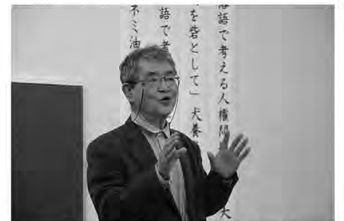
歴史や著書、事件などあらゆる着眼点から人権を語った犬養先生