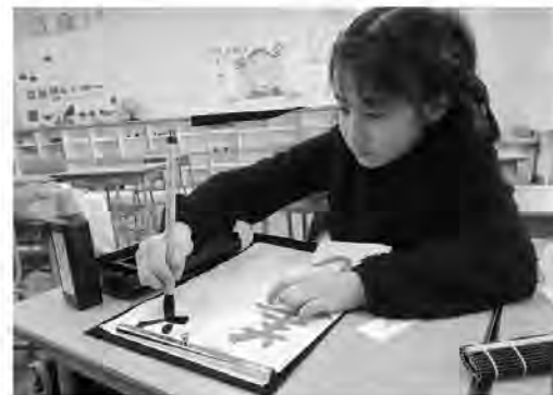
一筆ごとに集中した書道教室