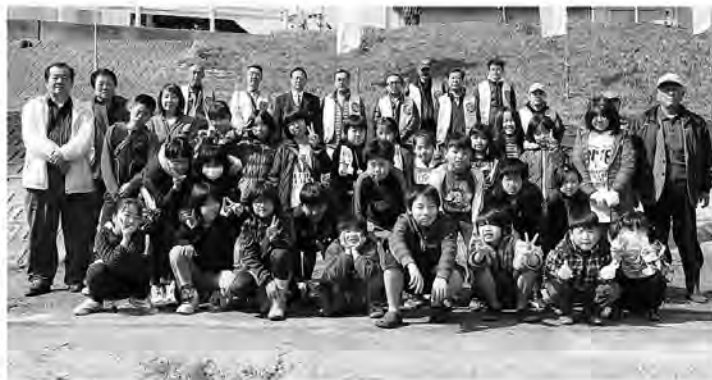
川をいつもきれいに保ちましょう