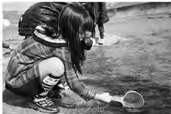
やさしく放り投げます