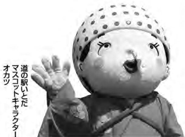
道の駅いとだ マスコットキャラクター オカッ

ゴールデンウィーク・日本最大級の人出を誇るイベントに田川8市町村の合同観光PRチーム「田川まるごと博物館どんたく隊」が出場します。8市町村のマスコットキャラクター「あいどる☆はっちーず」も大集合。あなたも田川の魅力を「まるごと」PRをしに行きませんか？