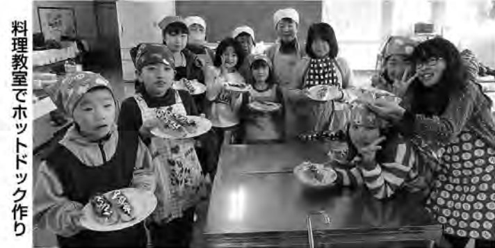
料理教室でホットドック作り