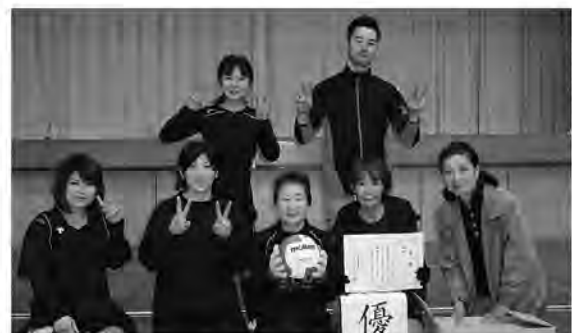
優勝した大熊合同チーム