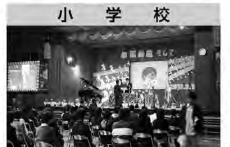
小 学 校

4月からは、今まで通い慣れた場所とは違うところで、新しい生活が始まります。不安やとまどいもあるでしょうが、それ以上に大きな夢や希望を胸に抱き、たくましくはばたいてくれることでしょう。