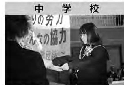
中 学 校