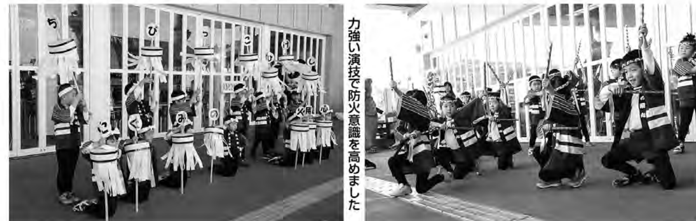
力強い演技で防火意識を高めました

春は風が強く空気も乾燥しがちなため、火災が発生しやすいと言われています。大事な命や財産を一瞬で奪ってしまう火事を未然に防ぐため、日ごろから防火を意識することが大切でしょう。