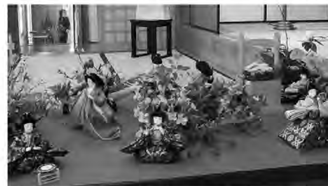
美しい花と人形にうっとり

3月2日、3日に伯林寺を会場におこなわれた花会に、隣保館講座生花教室の皆さんが作品を出品し、稽古の成果を披露しました。