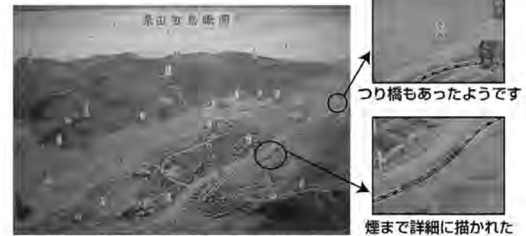
当時の糸田町を上から見た様子が描かれています つり橋もあったようです 煙まで詳細に描かれたSL列車

昔の糸田町を知ることができるもの1つとして、糸田小学校に保管されていた、昭和32年の卒業記念に糸田町の様子を描いた絵があります。よく見るとSL列車が走っていたり、烏尾峠にバスが走っていたりします。現在は残っていませんが、大熊周辺にあったつり橋の様子もわかります。皆さん、懐かしい糸田の様子を思い出しませんか?