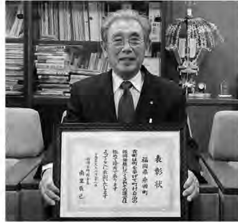
これからますます良町づくりに努めます

平成15年から取り組んできた機構改革などによる財政再建活動や、田川郡内に先駆けてメガソーラー発電所の誘致に成功したことなどが評価され、2月28日付けで福岡県町村会から糸田町が優良町村表彰を受けました。今後も、町の魅力を高めるとともに田川地域の更なる発展に向けてまい進していきますので、どうぞよろしくお願ひします。