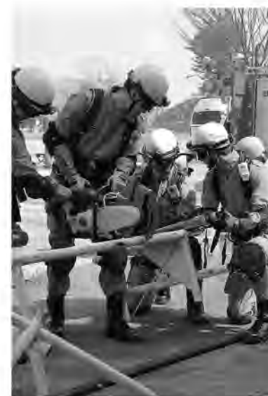
実際の事故現場さながらの訓練

平成23年3月に発生した東日本大震災を教訓とし、田川地域で同様の災害が起きたときに被害を最小限に食い止めるため、3月8日に田川市石炭・歴史博物館で防災訓練が実施されました。