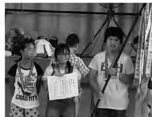
接戦を制し見事一位になった西部子ども会A