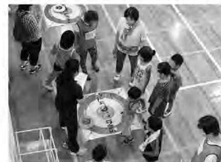
標的の中心に一番近いチームが得点ゲット