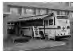
多くの方のみなさまのご協力をお願いします

石除去を含む)を受けられた人、現在、病氣治療中で注射や服薬をしている人は献血することができない場合があります。