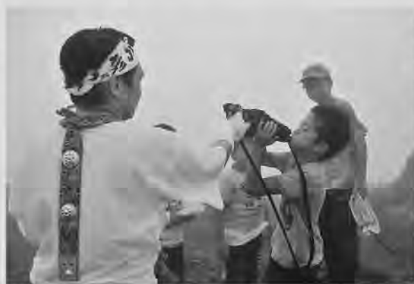
福智山山頂でほら貝にチャレンジ

登山で心身を鍛えつつ、集団生活などを通じて社会性を身につけることを目的とした「修験の道プログラム」が、7月29日から8月2日にかけておこなわれました。参加したのは田川市郡内の小学4年生～6年生の児童23人。牛斬山(香春町)・福智山(福智町)・英彦山(添田町)の3つの山を5日間にわたって登りました。自然の厳しさに触れるとともに、登山に帯同した地元ボランティアや田川青年会議所スタッフとの交流を通じて、地域のきずなを深めています。