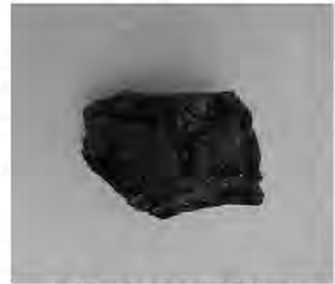
様々な交易の手がかりとなる黒曜石

今回ご紹介するのは、宮山遺跡で採取された黒曜石です。この黒曜石はガラス製の火山岩で、石器の材料として使用され、九州では大分県姪島や佐賀県腰岳などの産地が有名です。色調は黒色が多いですが、赤褐色や灰色の黒曜石もあります。また、産出する場所から遠く離れた遺跡で見られる例が多いため、地域の交流の状況を研究する資料として利用されます。