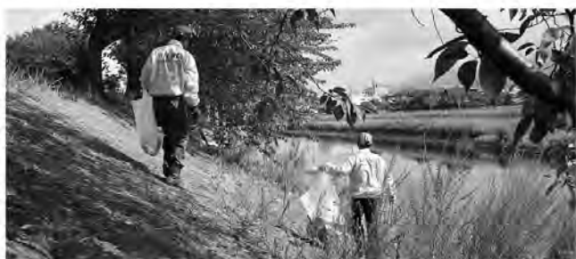
川岸からゴミがなくなりました

今回は糸田町でおこなわれ、特に空き缶やたばこの吸い殻が多く捨てられていた皆添橋から並ぶ桜の木周辺では、一つ一つ丁寧にゴミが拾い上げられてとても景観が良くなりました。