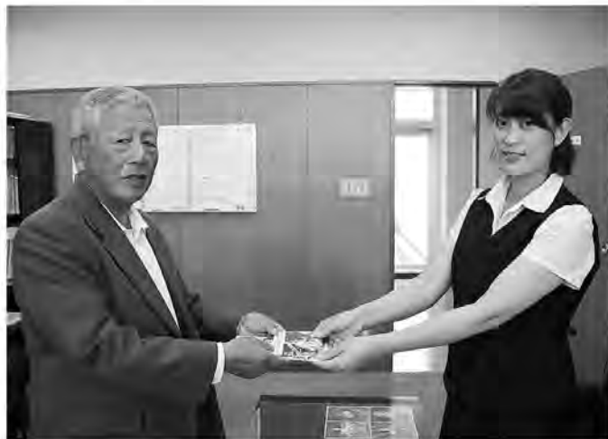
危険を避け、身の安全を守りましょう

今回贈られた反射板付きLEDライトは、やむを得ない夜間外出の際などにかばんに装着し活用します。