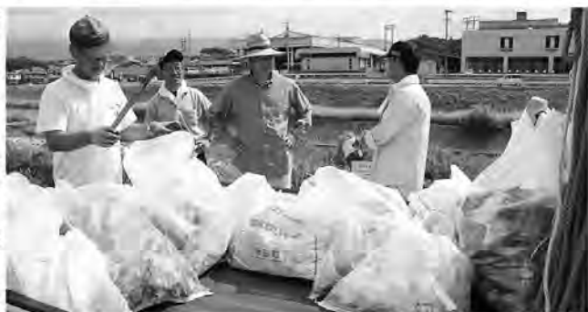
途中で収集されたゴミ袋、最終的には軽トラックいっぱいになりました