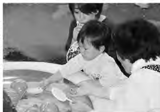
ボーイがやぶれないように

日が落ちてくるとペットボトル灯ろうに火が灯され、盆踊りがスタート。数人が踊り出すと次第に輪が大きくなっていき、振り付けの難しい糸田音頭もみなさん上手に踊っていました。最後は花火で締めくくり。地域の人に見守られながら手持ち花火に火をつける子どもたちは、きれいに燃える花火に夢中な様子でした。