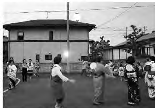
みんなで輪になり盆踊り