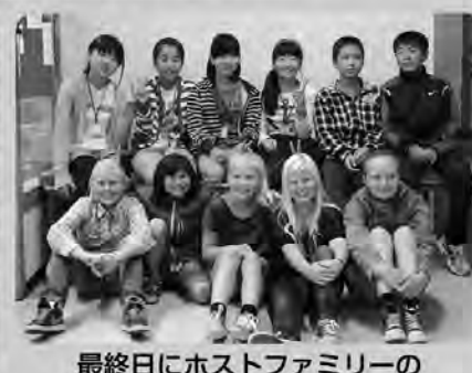
最終日にホストファミリーの子どもたちと