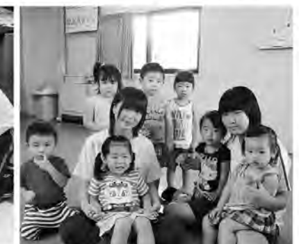
子どもたちとたくさん遊びました