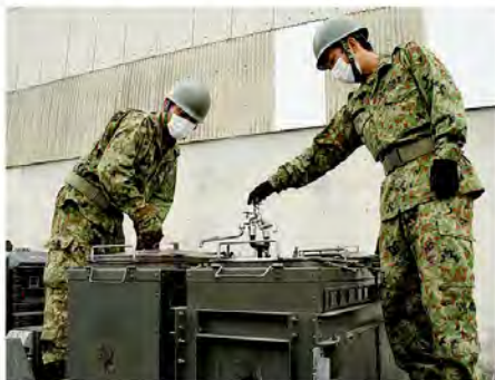
400食分の非常食を 供給する炊事車