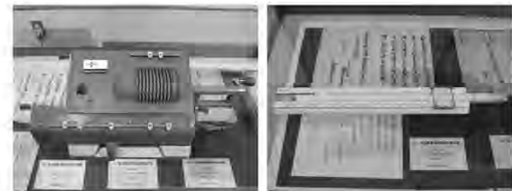
オドネルの計算機 計算尺

今回紹介するのは「オドネル計算機」と「計算尺」です。私自身は使用した経験がありませんが、オドネル計算機は数字を合わせる大変な作業が必要だったそうです。また計算尺はものさしみたいなもので、現地調査で簡単な計算に利用されていたようです。