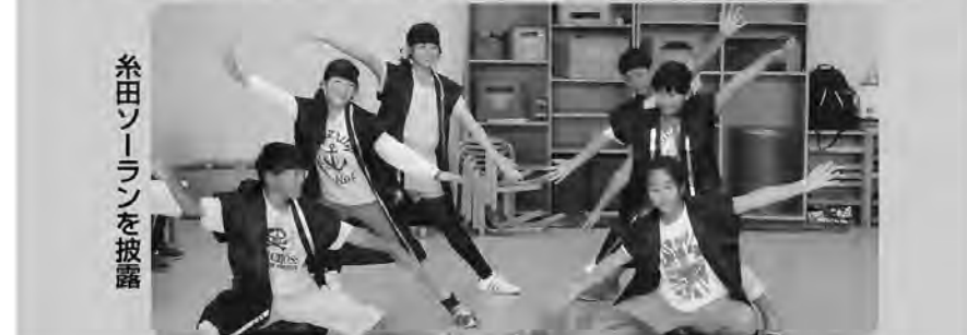
糸田ソーランを披露