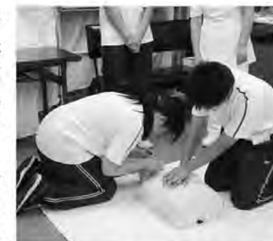
町立病院で心臓蘇生を学習

生徒たちは教育や医療、接客、販売などのうち自分が希望した場所で仕事を体験。初めての経験に戸惑いながらも、教えられた仕事を一生懸命にこなしていました。