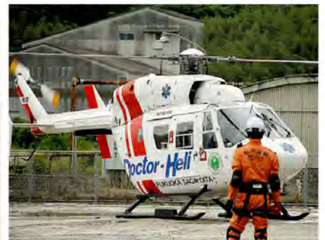
ドクターヘリで重傷患者を 早急に搬送します