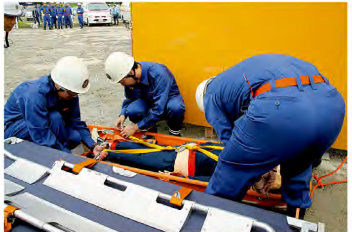
ビルから救助された負傷者を担架に移します

糸田町消防団は地震災害を想定した倒壊のおそれがあるビルからの要救助者救出訓練に参加し、田川地区消防本部や飯塚地区消防本部と協力して負傷者を救出。迅速な対応で負傷者を救護テントまで無事搬送し、日ごろの訓練の成果を十分に発揮しました。