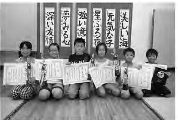
夏休みに書いた力作