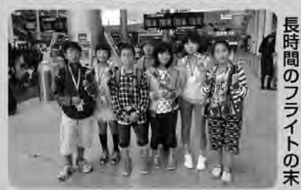
長時間のフライトの末