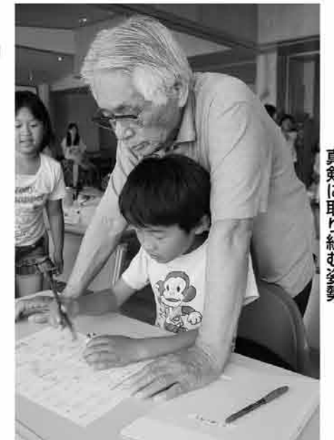
真剣に取り組む姿勢

糸田町学力補充教室の開講式が、中学校の部は6月8日に、小学校の部は6月11日にそれぞれ開かれました。この教室は学校外の学習時間を確保して、普段の授業だけでは理解が不十分なところを補うことがねらいで、小・中学校の児童・生徒の学力向上を目指すものです。 対象は小学4年生~6年生と中学1年~3年生で、開講式に続いておこなわれた授業に参加した子どもたちは、目を輝かせて学習に取り組んでいました。3学期末までの1年間、続けることが力になると信じて頑張ってくれることでしょう。 ※学力補充教室は対象学年の児童・生徒であれば随時受け付けます。詳細は担任の先生か教務課・学校教育係(電話26-3788)まで問合せください。