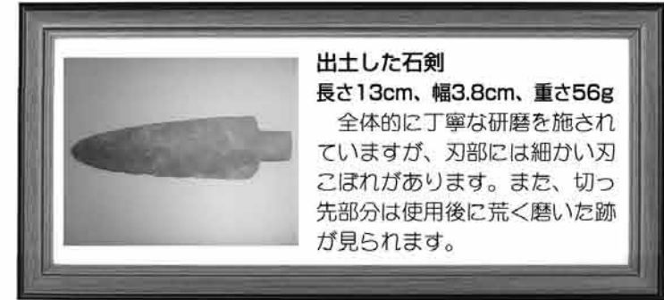
出土した石剣 長さ13cm、幅3.8cm、重さ56g 全体的に丁寧な研磨を施されていますが、刃部には細かい刃こぼれがあります。また、切っ先部分は使用後に荒く磨いた跡が見られます。

今回は、宮山遺跡から発掘された「石剣」を紹介します。この石剣は平成7年度に宮山遺跡南側を調査した際、石斧・石包丁などと一緒に発掘されたものです。