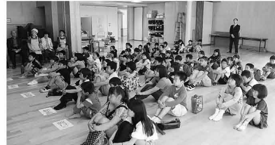
新たな体験に期待する子どもたち

5月18日に土曜サークルの開講式が糸田小学校の多目的ホールで開かれました。本年度は料理教室・パソコン教室・野外活動・書道教室・折り紙教室・スポーツ教室の6教室で約70人の児童が参加しています。 月一回の体験教室ですが、普段の生活では味わえない様々な体験が子どもたちを待っています。それぞれの教室に積極的な姿勢で取り組み、最後まで継続できた達成感ややりがいを感じることができるといいですね。