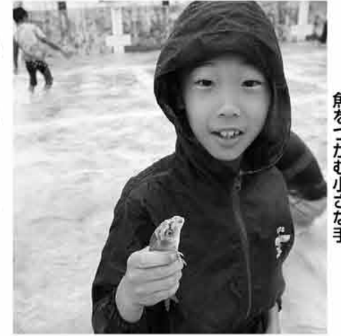
魚をつかむ小さな手

6月9日、糸田中学校プールで魚つかみ取り大会がおこなわれ、3歳から中学生まで約50人の子どもたちが集まりました。 小雨が降ったり止んだりの悪天候の中でも子どもたちは、プールに放されたおよそ400匹の大小色とりどりの魚を見て、始まる前から元氣いっぱい大興奮。 つかみ取りが始まると、魚のすばしっこい動きに苦戦してしまいましたが、笑顔で後を追うその姿は生き物との交流を楽しんでいるようでした。